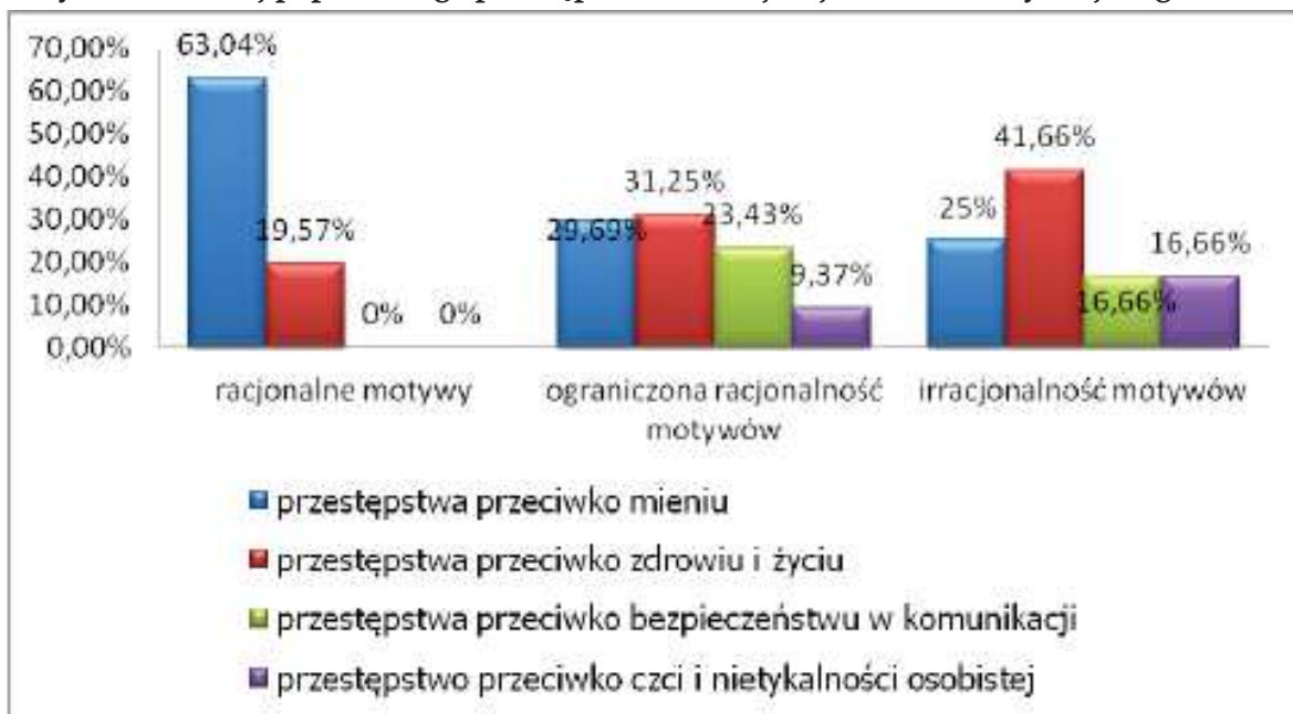
Wykres 2. Rodzaj popełnionego przestępstwa a rodzaj racjonalności motywacji - ogółem

Źródło: A. Tajak, Racjonalność motywów przestępstw , Kraków 2013, s. 116.