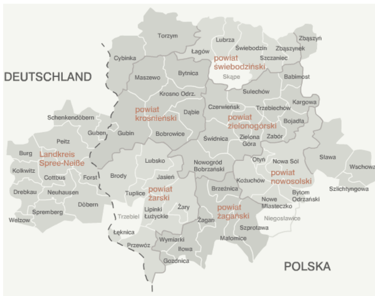
Rysunek 1. Euroregion „Sprewa-Nysa-Bóbr” stan na grudzień 2011 r.