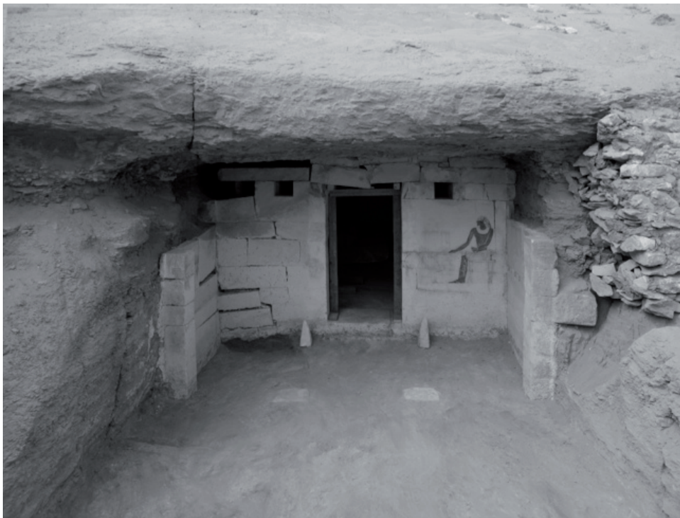
2. Fasada kaplicy grobowej Ichiego w Sakkarze. Na węgarach znajdują się inskrypcje przedstawione na il. 3; w podłodze widoczne bazy (niezachowanych) filarów portyku

polskich archeologów jest między innymi rozległe cmentarzysko dostojników działających na dworach kilku kolejnych władców VI dynastii, w XXIII stuleciu p.n.e. Jeden z większych grobowców, odkryty w 2002 roku, należał do urzędnika o imieniu Ichi 23 .