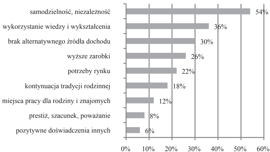
Rys. 1. Motywy prowadzenia własnej działalności gospodarczej (odpowiedzi nie sumują się do 100%)

Respondentów zapytano o główne czynniki motywujące ich do prowadzenia działalności gospodarczej. Najczęstszym powodem prowadzenia własnej działalności gospodarczej przez badanych przedsiębiorców, który zadeklarowała ponad połowa respondentów, była chęć osiągnięcia niezależności i samodzielności (54%). Kolejną przyczyną to możliwość wykorzystania zdobytej wiedzy i wykształcenia w praktyce (36%). Równie często przedsiębiorcy kierowali się w swoim wyborze brakiem alternatywnego źródła dochodu oferowanego przez publiczne bądź prywatne zakłady pracy w miejscu zamieszkania (30%), a także chęcią osiągnięcia wyższych zarobków (26%). 11 przedsiębiorców motywowała chęć zaspokojenia potrzeb rynku (22%), a 18% badanych perspektywa kontynuacji tradycji rodzinnej. Respondenci w mniejszym stopniu wskazali na pozostałe motywy, takie jak: stworzenie miejsc pracy dla członków rodziny bądź znajomych (12%), zyskanie szacunku i prestiżu (8%), a także sugerowanie się pozytywnymi doświadczeniami innych przedsiębiorców (6%). Szczegóły przedstawiono na rys. 1.