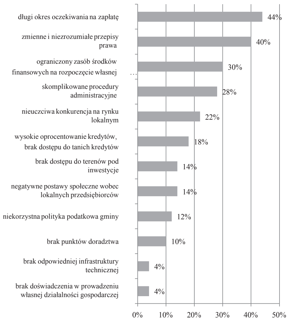
Rys. 3. Bariery rozwoju przedsiębiorczości na obszarach wiejskich powiatu radzyńskiego w opinii właścicieli przedsiębiorstw (odpowiedzi nie sumują się do 100%)

Respondenci dostrzegli więc znacznie więcej barier niż czynników wpływających pozytywnie na funkcjonowanie i wzrost ich działalności gospodarczych.