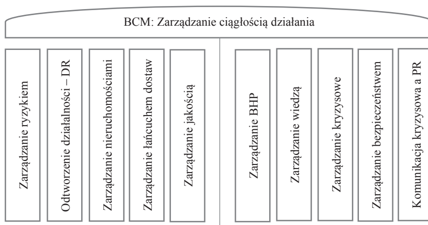
Rys. 2. Holistyczny proces zarządzania ciągłością działania

Można stwierdzić, iż zarządzanie ciągłością działania jest holistycznym procesem zarządzania, który ma na celu określenie potencjalnego wpływu na organizację i stworzenie warunków budowania odporności na nie oraz zdolności skutecznej reakcji w zakresie ochrony kluczowych interesów właścicieli, reputacji i marki organizacji, a także wartości osiągniętych w dotychczasowej działalności [Wołowski, Zawila-Niedźwiecki 2012, s. 285].