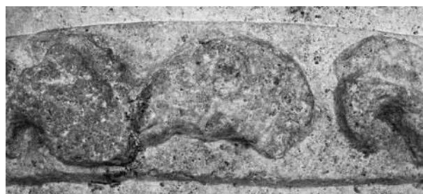
Fig. 5. Fragment pasa posągu z Tyras

W kulturze materialnej ponownie zasiedlonego Nikonion widoczne są cechy greckie i sarmackie, ale też być może tzw. późnoscytyjskie 65 . W miejscu dawnego miasta wznoszono podobne pod względem rozmiarów domy, lecz zbudowane nie z kamienia, ale przede wszystkim z drewna i suszonej cegły 66 (Fig. 7). Ściany działowe wznoszono z plecionek umacnianych polepą. Ponownie wykorzystywano kamienie wydobywane z dawniej istniejących domów. Zmarli Nikonijczycy byli grzebani na oddalonym o kilkaset metrów cmentarzu, niedaleko od istniejącej w okresie klasycznym nekropolii. Zmarłe małe dzieci grzebano tak jak dawniej w dużych naczyniach wkopywanych w podłogi domów. Taki obiekt odkryto między innymi w roku 2012. Był to pochówek płodu zmarłego około 28 tygodnia ciąży i złożonego do amfory po winie, datowanej metodą typologiczną na II-początek III wieku n.e. W poprzednich latach znajdowano podobne pochówki starszych, nawet kilkuletnich dzieci. Możliwe, że w pierwszych wiekach naszej ery Nikonion było otoczone murem obronnym 67 , chociaż dotychczasowy stan badań nie pozwala ani tej tezy potwierdzić ani obalić. Jest jednak prawdopodobne, że przebywający tam Sarmaci byli sojusznikami Rzymian i współpracowali z garnizonom w Tyras, np. dostarczając informacji wywiadowczych 68 . Przebywający w Nikonion Grecy byli zapewne obywatelami Tyras 69 .