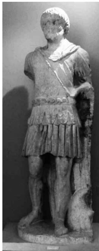
Fig. 3. Kamienny posąg z II wieku znaleziony w Tyras, prawdopodobnie przedstawiający cesarza Antonina Piusa. Zbiory Muzeum Archeologicznego w Odessie

Zabytkiem związanym z obecnością Rzymian nad Dniestrem jest ponad naturalnej wysokości stojący posąg mężczyzny znaleziony w Tyras 58 (Fig. 3, 4). Jest on częściowo zniszczony i zapewne z tego powodu nie cieszył się nigdy szczególnym zainteresowaniem badaczy. Przy jego lakonicznym opisie podano informację, że przedstawia oficera, może legata Mezji Dolnej, z pierwszej połowy II wieku 59 . Nie zwrócono jednak większej uwagi