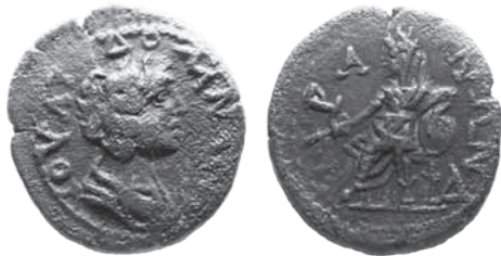
Fig. 6. Brązowa moneta Tyras o nominale 4 jednostek (assariów?) z podobizną Julii Domny – pod względem ikonograficznym i wagowym podobna do monet bitych w Mezji Dolnej i Tracji

Na terenie dolnego Naddniestrza istniał również szereg mniejszych osad. Było ich znacznie mniej niż w okresie klasycznym jednak we wszystkich znanych przypadkach zajmowały one dawniej zasiedlone miejsca. Początek ponownego zasiedlenia Budżaku można datować na przełom II i III wieku 70 . Dokonali tego Sarmaci, zajmujący dotychczas tereny na wschodnim brzegu Dniestru. Moim zdaniem jest możliwe, że czynnikiem, który zdecydował o przemieszczeniu Sarmatów do Budżaku było nie tyle samo „pozwolenie” ze strony Rzymian, chociaż bez wątplenia dokonało się to w porozumieniu z Rzymianami, co zmiany klimatyczne, dzięki którym tereny te stały się znowu atrakcyjne dla koczowników. Jak pozwalają sądzić wyniki badań archeologicznych różne grupy Sarmatów z czasem zaczęły tam osiadać, w późniejszym okresie mając swój wpływ uformowanie społeczności zaliczanej do jednej z grup kultury czerniachowskiej.