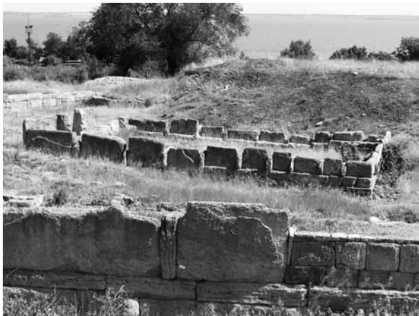
Fig. 2. Pozostałości tak zwanego „budynku weksyliacji” w Tyras po pracach konserwatorskich, stan z roku 2010