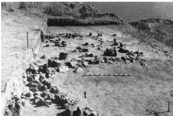
Fig. 7. Fragment typowych pozostałości budowli z pierwszych wieków naszej ery w Nikonion. Obiekt badany w 1998 roku