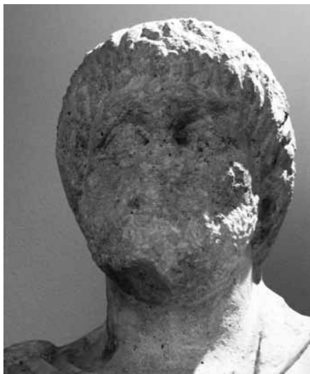
Fig. 4. Twarz posągu z Tyras

wraz z całym dolnym Naddniestrzem było częścią Cesarstwa Rzymskiego 61 . Owo dostosowanie systemu monetarnego Tyras do systemu obowiązującego w Mezji Dolnej i Tracji byłoby dokonane już po przyłączeniu Tyras do Cesarstwa 62 (Fig. 6). Pod koniec II wieku podobne zjawisko nastąpiło w mennictwie Olbii 63 . Żyjący w II wieku Klaudiusz Ptolemeusz wskazał bowiem Tyras i Nikonion między miastami Mezji. Jak się uważa, wspomniane przez Ptolemeusza Nikonion zostało niedługo wcześniej zasiedlone, bo około roku 100. Nastąpiło to po około 300 latach przerwy. Nikonion miało wtedy już inny charakter niż w okresie archaicznym i klasycznym 64 . Wskazanie kim byli ówczesni mieszkańcy tego miejsca nie jest już tak oczywiste jak w przypadku okresu archaicznego i klasycznego.