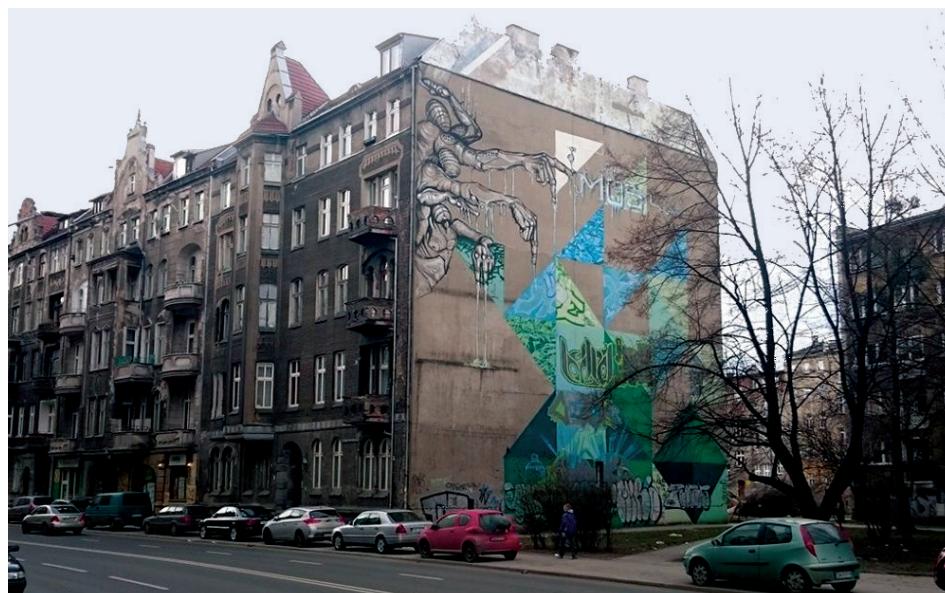
Il. 8. Mural nr 5, Głodomorzy , przy pierzei ul. Wyszyńskiego

The mural is oriented vertically and its colours have been limited to two: blue and green in their many shades. The emphasis of the entire layout is formed by three figures which are painted in the upper left corner of the tenement house and are distinguished by colour and form from the rest of the image (the name “guzzlers” was given by a journalist who described the creative activity of their author – Filip Skont Nizołek [13]). The whole layout is full of strong internal contrasts. Geometry and division versus human and rounded shapes. It is also possible to