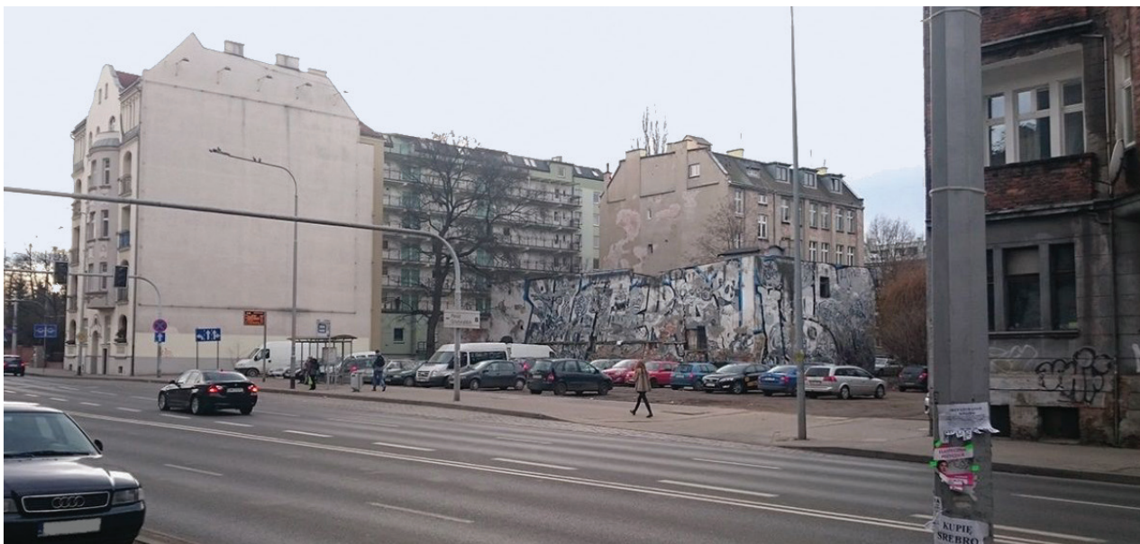
Il. 7. Mural nr 4, Materializm , przy ul. Wyszyńskiego

The mural was designed in a horizontal orientation. The colours are limited to black, white, grey and blue as an emphasis of letters’ framings which form the slogan “materialism”. The grey scale of colours, which were used in the mural, harmonizes with the creamy facade of building No. 52 as well as with the grey facade of the object behind it creating a harmonious combination. Through the location, which is set back in relation to the frontage, the mural draws the viewers’ attention and makes them carefully watch the facades. Its structure and form is a peculiar camouflage for the building due to which the perception of this space is not negative. We are dealing here with