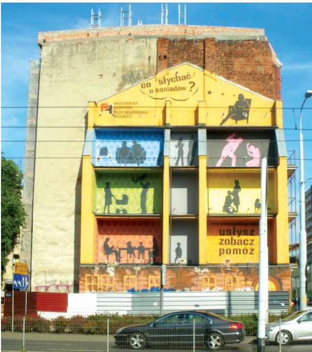
Il. 3. Mural nr 1, Co słyhać u sąsiadów?