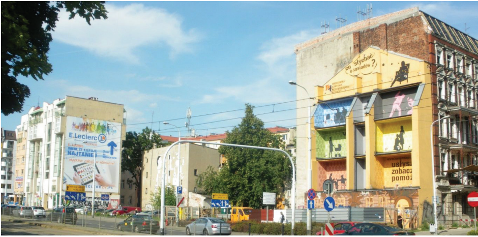
Il. 2. Mural 1 i 2 przy ul. Wyszyńskiego