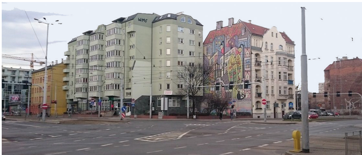
Il. 5. Mural nr 3 przy skrzyżowaniu ul. Wyszyńskiego i Sienkiewicza