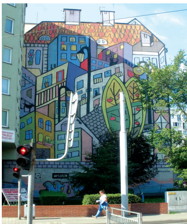
Il. 6. Mural nr 3, Muralia

The mural has a vertical orientation and is painted in pastel colours. Thanks to the application of muted colours with a similar intensity of saturation, the effect of coherence with the surrounding colours of the facade was achieved. Architectural elements were introduced to its design (small roofs, chimneys, windows) trying to imitate the facade of the building to some extent. This allows for experiencing the illusion of the additional and finite facade of tenement house No. 52 and creating a bridge between the two objects. This procedure gives the opportunity of a comprehensive perception of the corner by camouflaging a dead space. Also here, as in the previous examples, we deal with "plaster", a cover for the undeveloped space. However, unlike the previously discussed, this mural, despite the fact that it fills the entire space and is limited by the edges of the wall surface, is not an autonomous entity. Posing as another facade it blends into the adjacent environment and influences the recipients' perception along with it. Hence the effect of