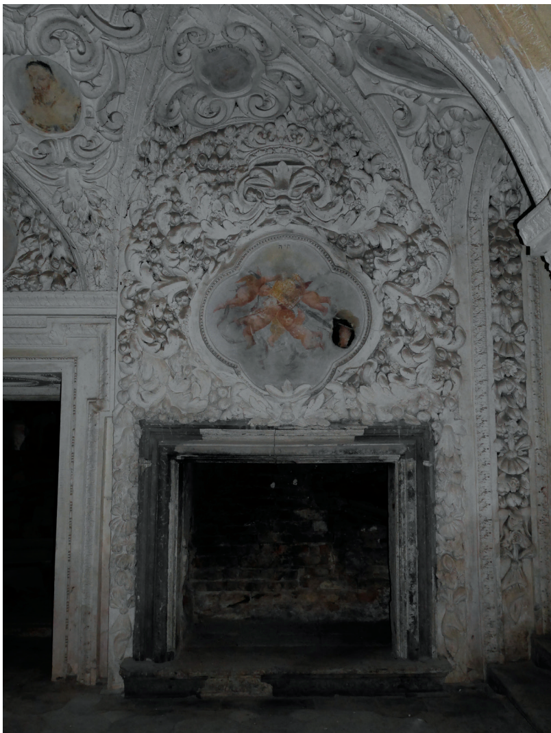
Dekoracja sztukatorska sala terrena w pałacu w Gorzanowie (fot. M. Jagiełło, 2016) Stucco decoration sala terrena in the palace in Gorzanów (photo by M. Jagiełło, 2016)