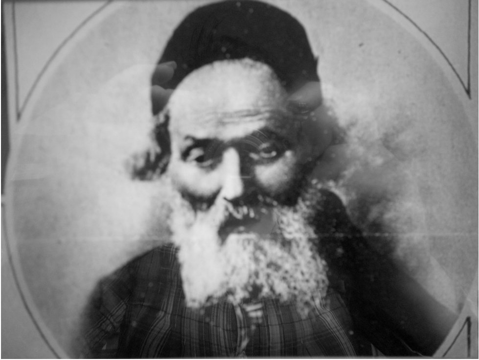
Fot. 3. Israel Mejer Kagan.

jest bardzo znana w żydowskiej tradycji jako autor dzieła Chofec Chaim i założyciel ruchu Musar itd.