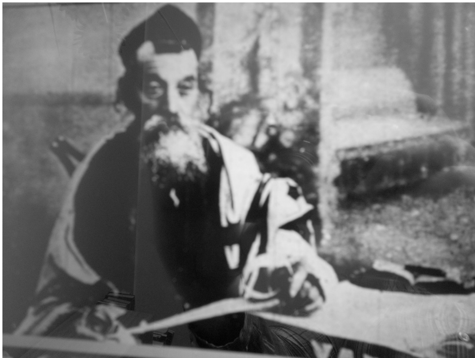
Fot. 1. Żydowski sojfer.

YIVO na ekspozycji pokazało 5 zdjęć wykonanych jakoby w Radzynie Podlaskim. Niestety, dwa z nich pochodzące z „Forward” nie zostały wykonane na ziemi radzyńskiej. Pierwsze, z 1923 r. przedstawia sojfera, czyli osobę, która, wedle ścisłych reguł, przepisywała Torę (fot. 1). Zwyczaj ten utrzymywał się mimo wynalezienia druku. Gdy sięgnęłam do oryginału, okazało się jednak, że pod fotografią nie ma informacji o radzyńskim pochodzeniu sojfera. Natomiast obok tego zdjęcia zamieszczono w gazecie inne wykonane w Radzynie, którego brak w katalogu YIVO. Ktoś więc pomylił się i błędnie zidentyfikował tego Żyda jako radzyńskiego sojfera.