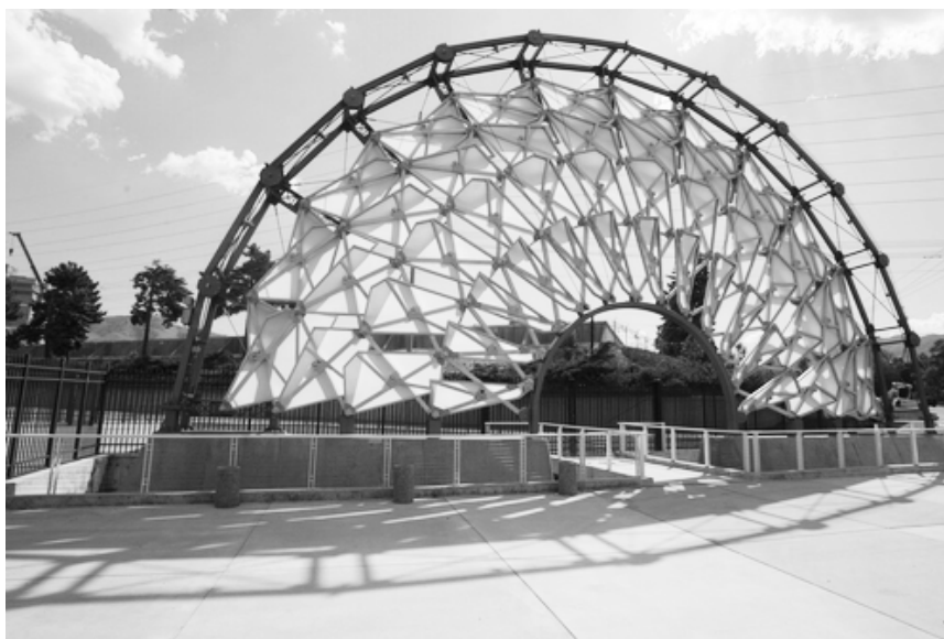
Rysunek 3. Chuck Hoberman – Hoberman Arc – przykład projektowania parametrycznego z wykorzystaniem wielopłaszczyznowego ruchu.