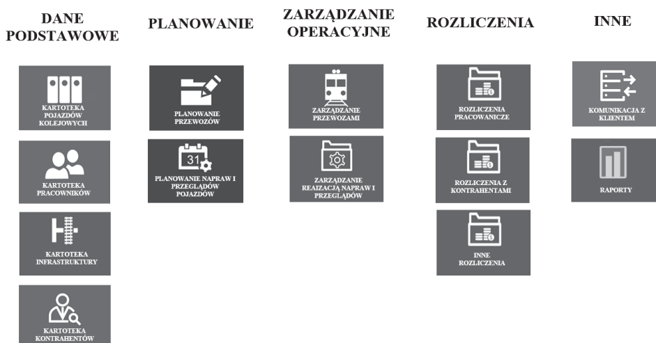
Rys. 1. Przykładowa funkcjonalność systemu informatycznego wspomagającego podejmowanie decyzji w zakresie obsługi przewozów kolejowych.