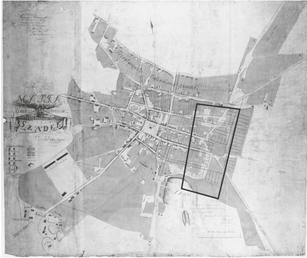
Ryc. 2. Granice Nowego Miasta

lokacyjne. Projektowane „nałożenie” było jednak stosunkowo niewielkie i w zasadzie przebiegało wzdłuż wschodniej granicy wyznaczonego przez mnie średniowiecznego miasta lokacyjnego.