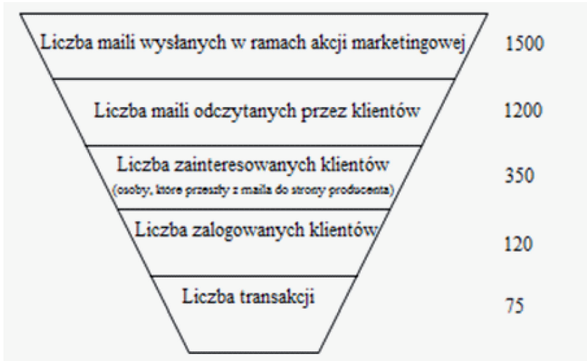
Rys. 1. Przykładowy lejek sprzedaży dla kampanii mailingowej wraz z liczbą akcji danego typu 7

Na stronie producenta klient mógł zrezygnować dlatego, że dowiedział się na temat produktu czegoś, czego nie sugerowały ilustracje, że np. garnitur jest tylko poliestrowy, buty nie są wykonane ze skóry, itp.