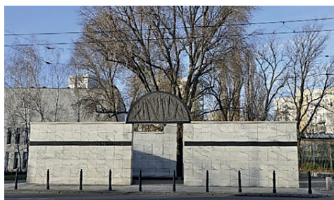
Ryc. 5. Umschlagplatz

Pomnik symbolizujący otwarty wagon towarowy dla upamiętnienia deportacji ofiar getta warszawskiego do hitlerowskich obozów zagłady w czasie II wojny światowej, ul. Stawki, Warszawa