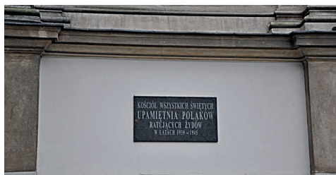
Ryc. 9. Kościół Wszystkich Świętych przy pl. Grzybowskiem w Warszawie wraz z tablicą upamiętniającą Polaków ratujących Żydów w latach 1939–1945

Kraków, Lublin i Warszawa były przez kilkaset lat głównymi ośrodkami kultury żydowskiej w Polsce, dziś te trzy miasta są licznie odwiedzane przez turystów krajowych i zagranicznych, wielu przyjeżdżających spoza Europy, ale twierdzących, że mają tu swoje rodowe korzenie. Dlatego „Poland Jewish Tours”, „Warsaw Jewish Tours” czy „Warsaw – Krakow Jewish Tours” są postrzegane nie tylko jako okazja do odwiedzenia miejsc historycznych, krajoznawcza turystyka miejska lub popularny wśród młodego pokolenia „city break”, ale także turystyka nostalgiczna: okazja do uczestniczenia w tradycjach religijnych, do udziału