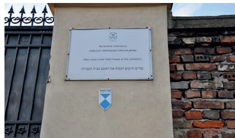
Ryc. 7., 8. Cmentarz żydowski przy ul. Okopowej w Warszawie