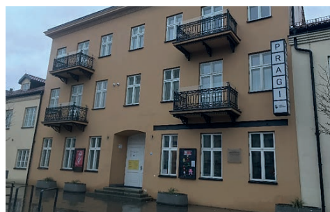
Ryc. 12. Muzeum Pragi (dawny dom modlitwy) ul. Targowa 50/52 w Warszawie Fot. A. Ostrowska-Tryzno, 2020

Kolejnym niedawno dodanym wydarzeniem jest „Święto Ulicy Próznej”, organizowane podczas corocznego wiosennego wieczoru muzealnego w Warszawie. Turyści odwiedzający Warszawę podczas tych wydarzeń mogli poznać lepiej kulturę żydowską, zainspirować się ogromnym dziedzictwem materialnym i niematerialnym. Nasze badania wykazały, że bogactwo dziedzictwa żydowskiego jest ważne także dla mieszkańców Warszawy. Popularność Muzeum POLIN oraz długa kolejka chętnych do odwiedzenia Synagogi Nożyków podczas corocznej „Nocy Muzeów” są tego najlepszym dowodem [nimoz.pl, 2020], (tabela 1). Nie trzeba dodawać, że poznawanie wspólnej kultury i tradycji jest najlepszym sposobem na poprawę relacji, na budowanie tolerancji i zrozumienia. Turystyka opiera się na interakcji między ludźmi i jest ważnym narzędziem promocji kultury i dialogu międzykulturowego.