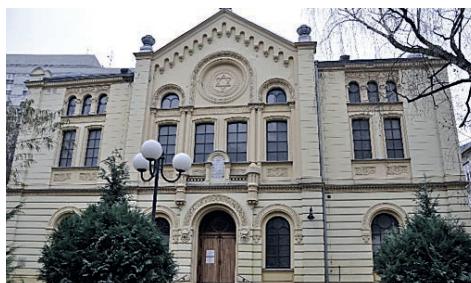
Ryc. 6. Synagoga Nożyków przy ul. Twardej 6 w Warszawie