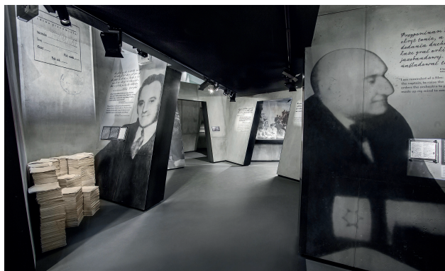
Ryc. 14. Wnętrze wystawy archiwum E. Ringelbluma Muzeum POLIN