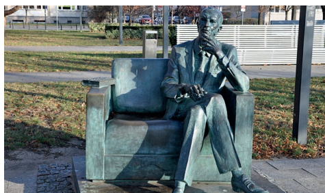
Ryc. 3. Pomnik Jana Karskiego, przy Muzeum Historii Żydów Polskich POLIN Jan Karski był polskim żołnierzem i kurierem w czasie II wojny światowej, który przygotowywał raporty o zniszczeniu przez Niemcy getta warszawskiego i nazistowskich obozów zagłady w okupowanej Polsce