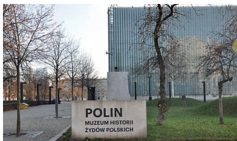
Ryc. 2. Budynek Muzeum Historii Żydów Polskich POLIN w Warszawie, widok od strony ul. J. Lewartowskiego Fot. A. Ostrowska-Tryzno, 2020