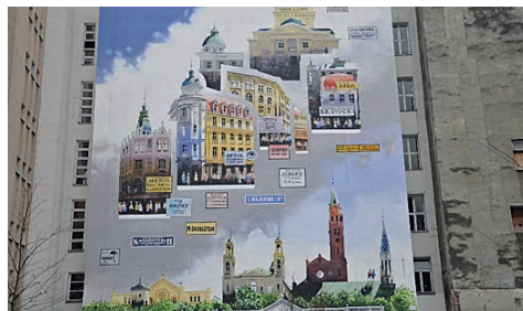
Ryc. 11. Mural „Warszawa żydowska” Tytusa Brzozowskiego ul. Prózna 12 w Warszawie Fot. A. Ostrowska-Tryzno, 2020

Kolejnym niedawno dodanym wydarzeniem jest „Święto Ulicy Próznej”, organizowane podczas corocznego wiosennego wieczoru muzealnego w Warszawie. Turyści odwiedzający Warszawę podczas tych wydarzeń mogli poznać lepiej kulturę żydowską, zainspirować się ogromnym dziedzictwem materialnym i niematerialnym. Nasze badania wykazały, że bogactwo dziedzictwa żydowskiego jest ważne także dla mieszkańców Warszawy. Popularność Muzeum POLIN oraz długa kolejka chętnych do odwiedzenia Synagogi Nożyków podczas corocznej „Nocy Muzeów” są tego najlepszym dowodem [nimoz.pl, 2020], (tabela 1). Nie trzeba dodawać, że poznawanie wspólnej kultury i tradycji jest najlepszym sposobem na poprawę relacji, na budowanie tolerancji i zrozumienia. Turystyka opiera się na interakcji między ludźmi i jest ważnym narzędziem promocji kultury i dialogu międzykulturowego.