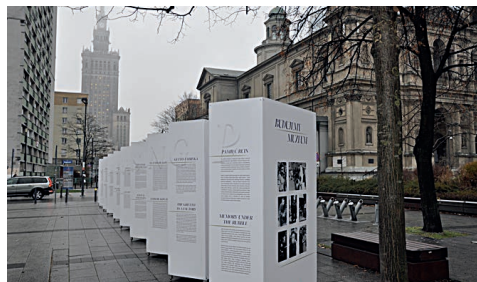
Ryc. 10. Wystawa plenerowa prezentująca życie codzienne w Getcie w 1943 r. Instalacja na pl. Grzybowskim w Warszawie