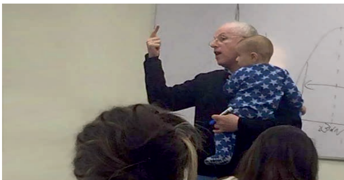
Fot. 1. Sidney Eldenberg na wykładzie

W dyskusji nad wyrównywaniem szans kobiet i mężczyzn w nauce i na uniwersytecie poza wymiarem zawodowym równie istotny jest wymiar edukacyjny. Bo choć dostęp do studiów wyższych nie jest limitowany płcią, to tak jak w przypadku kobiet–naukowczyń, tak i w przypadku studentek pojawiają się macierzyństwo i opieka jako bariery w normatywnym odgrywaniu roli studentki. Wiosną 2015 media społecznościowe poświęcały sporo uwagi Sidneyowi Engelbergowi – wykładowcy z Jeruzolimy. Zdjęcia, na których trzymał dziecko jednej ze studentek prowadząc wykład, wywołały duży rezonans społeczny. Bohater zdjęć został ucieleśnieniem uniwersyteckiego ideału: wykładowcy, człowieka nauki, który nie dość, że dzieli się swoją wiedzą, to akceptuje fakt, że jego studentki i studenci rodzicami i potrzebują aktywnego wsparcia. Sam Engelberg swoje zachowanie wobec płaczącego dziecka, które wziął na ręce i uspokoił, skomentował słowami: „żadna matka nie powinna stawać przed wyborem pomiędzy dzieckiem i kontynuowaniem edukacji” ( http://www.tvp.info/20061538/chciala-wyjsc-z-wykladu-bo-jej-dziecko-plakalogest-wykladowcy-zaskoczyl-wszystkich ). Zachęcał również studentów–rodziców, aby zabierali dzieci na zajęcia, a studentki, by bez skrępowania karmiły swoje dzieci również w trakcie zajęć.