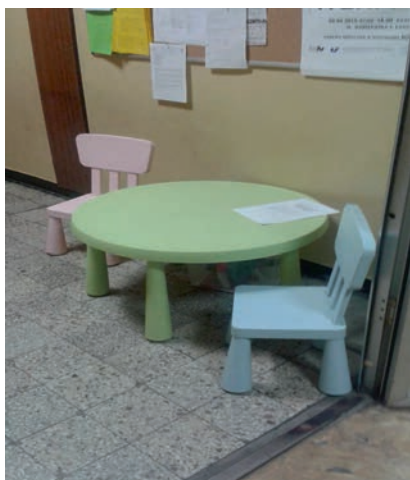
Fot. 2. Przed dziekanatem

Oznacza to w praktyce stosowanie rozwiązań wymienionych w ankiecie rozesełanej uczelniom wyższym przez upoważnione do tego przez MNiSW Stowarzyszenie Doradców Europejskich PLinEU. Narzędzie to zatytułowane „Ankieta dla uczelni” 5 zwraca uwagę na trzy wymiary funkcjonowania szkół wyższych bezpośrednio związane z polityką antydyskryminacyjną wobec rodziców: finansowy, organizacyjny i infrastrukturalny. Wymiar finansowy obejmuje pieniądze świadczenia z tytułu urodzenia dziecka przeznaczone dla studentów i studentek oraz doktorantów i doktorantek.