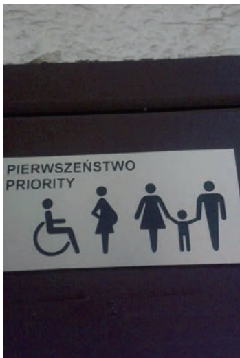
Fot 5. Tabliczka pierwszeństwa