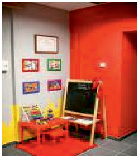
Fot. 4. Kącik zabaw