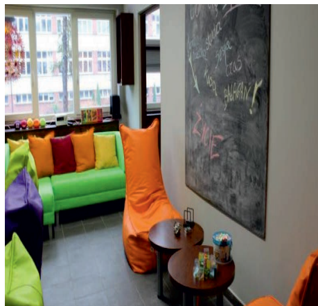
Fot. 3. Miejsce relaksu