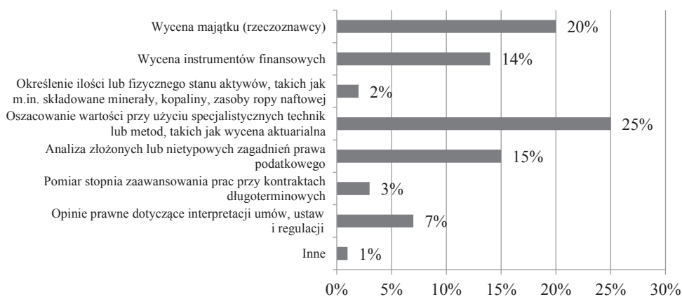
Rys. 2. Struktura odpowiedzi na pytanie dotyczące potrzeby powołania przez biegłego rewidenta ekspertów z różnych dziedzin