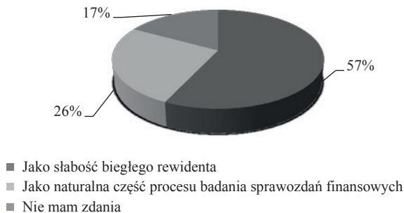
Rys. 3. Struktura odpowiedzi na pytanie dotyczące sposobu postrzegania korzystania przez biegłego rewidenta z pomocy ekspertów zewnętrznych

W jaki sposób Pani/Pana zdaniem jest postrzegane korzystanie przez biegłego rewidenta z pomocy ekspertów zewnętrznych?