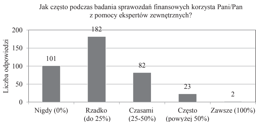
Rys. 1. Struktura odpowiedzi na pytanie dotyczące częstotliwości korzystania przez biegłych rewidentów z pomocy ekspertów zewnętrznych

Ankietowani wybierali odpowiedzi spośród zamkniętego katalogu wariantów. Rezultaty badania zaprezentowane zostały na rys. 1-4.