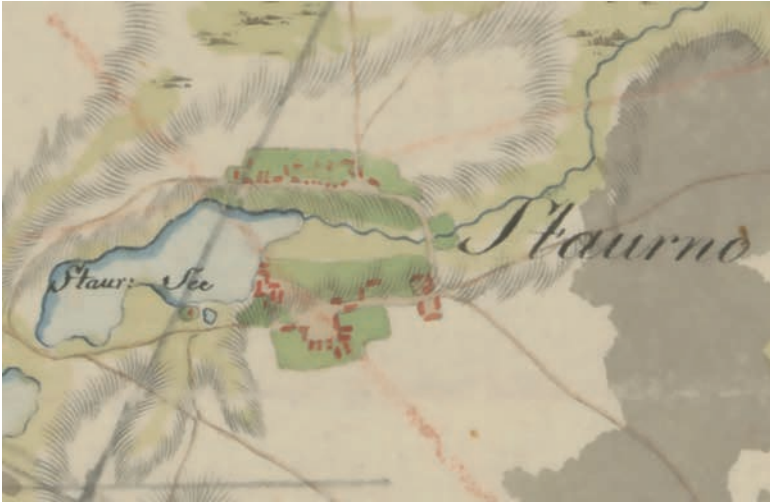
Ryc. 1. Sławno na fragmencie mapy Davida Gilly'ego z końca XVIII wieku. Źródło 1

FIG. 1. Sławno on an excerpt from David Gilly's map of the late 18th century. Source 1