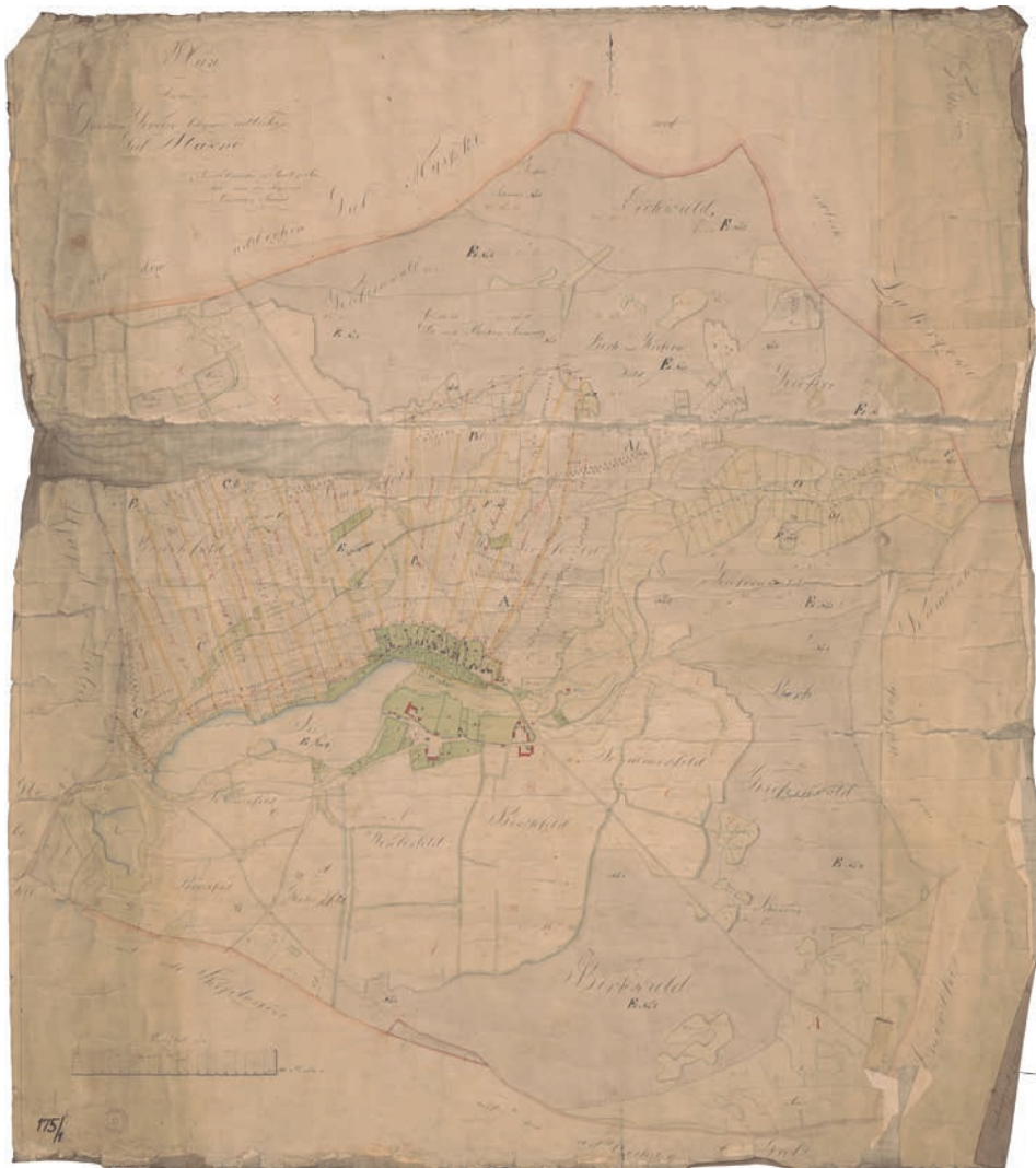
Ryc. 3. Mapa uwłaszczeniowo-regulacyjna wsi Sławno z 1827 roku, sporządzona przez miernicze- go Schnepela. Źródło 3