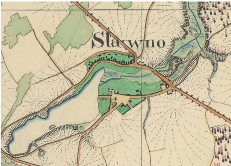
Ryc. 2. Sławno na fragmencie mapy Urmesstichblatt z 1830 roku. Źródło 2

FIG. 1. Sławno on an excerpt from David Gilly's map of the late 18th century. Source 1