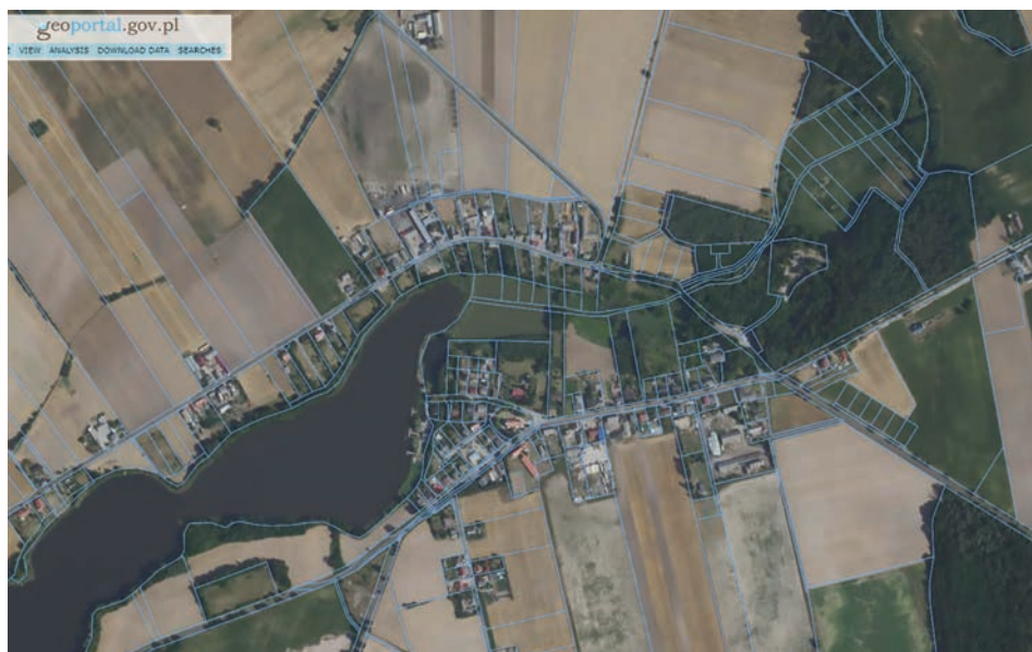
Ryc. 5. Współczesny układ wsi Sławno, www.geoportal.pl , z dn. 17.11.2022 r.