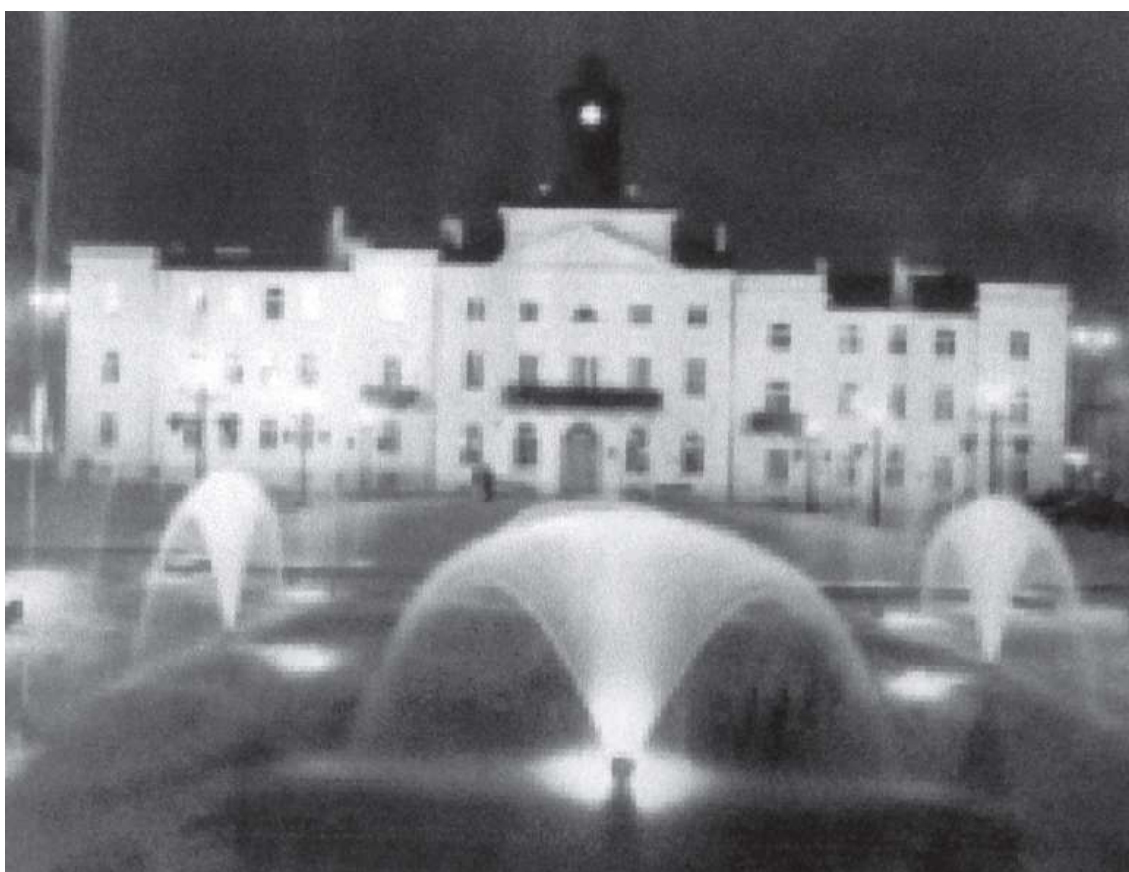
Ratusz i fontanna Afrodyta w Płocku