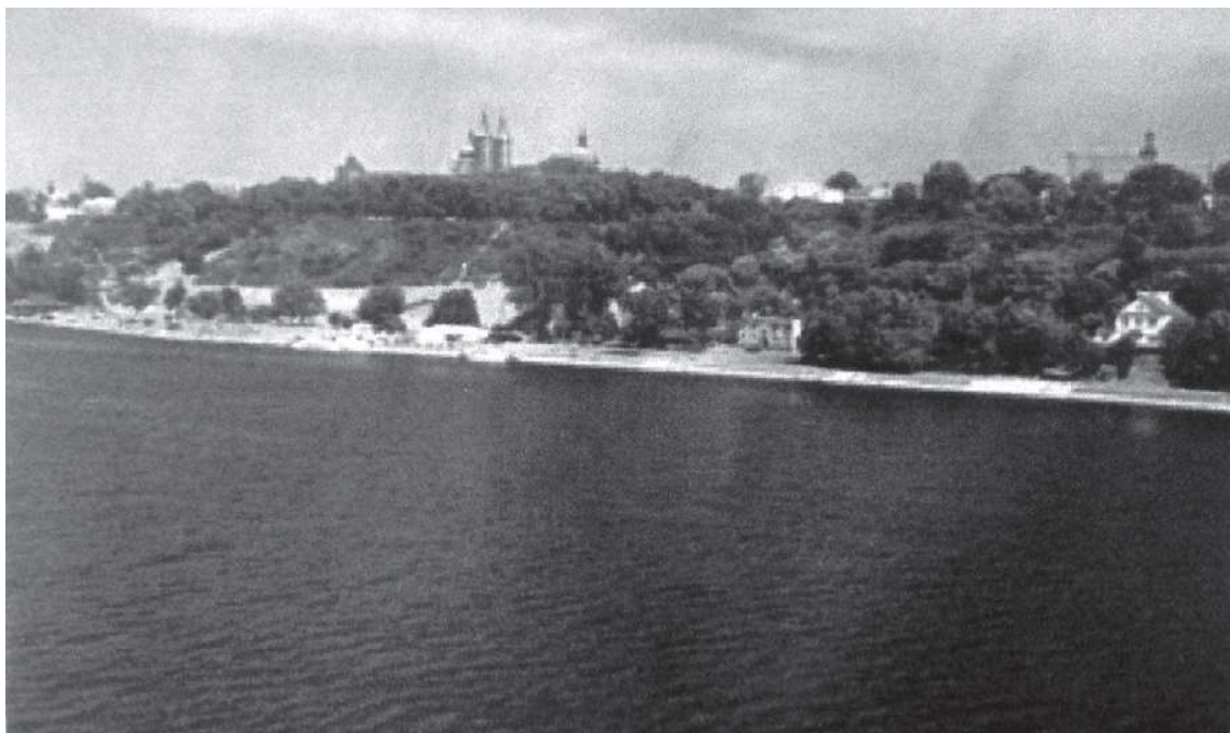
Wzgórze Tumskie w Płocku