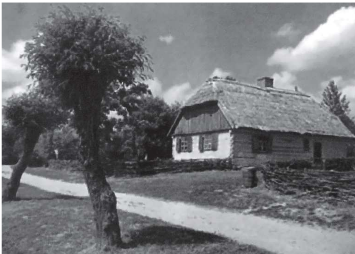
Stara chata w Muzeum Wsi Mazowieckiej w Sierpcu