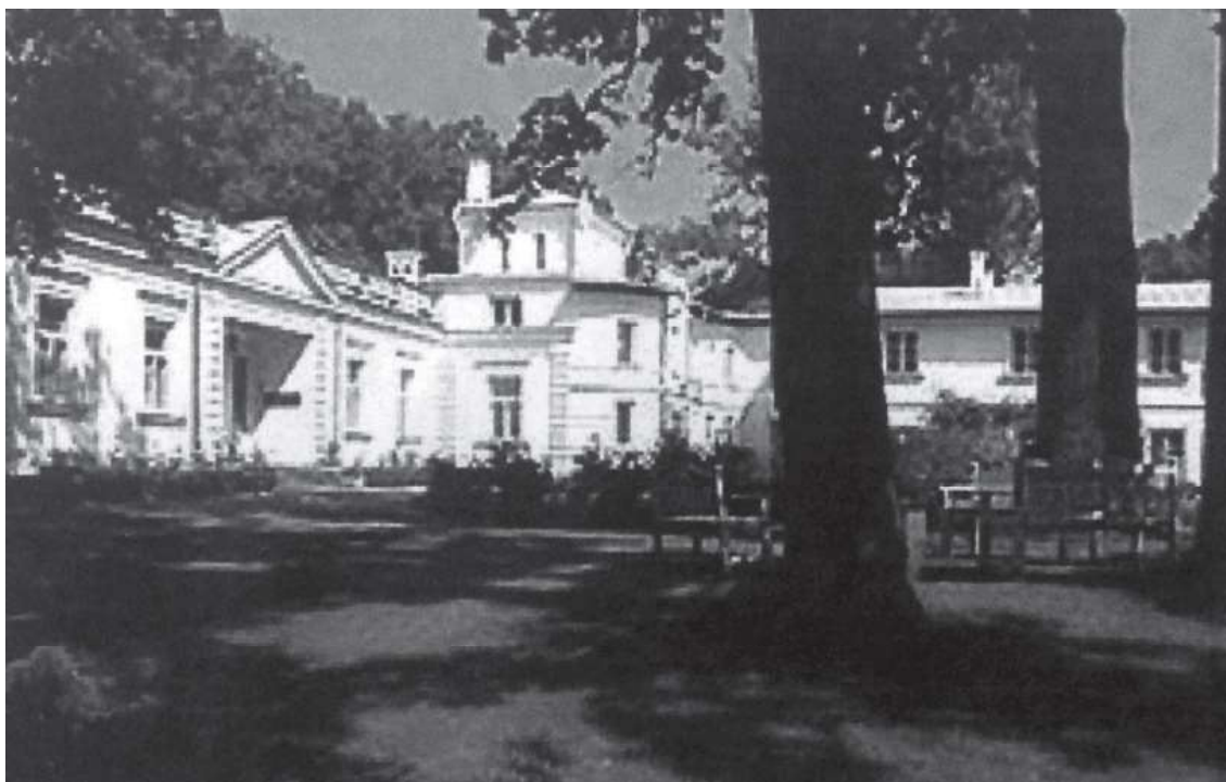
Dworek z XIX w. w Srebrnej