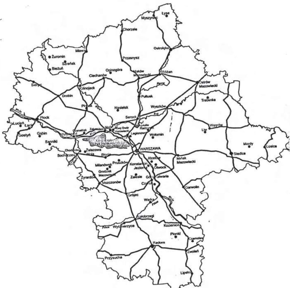
Region mazowiecki.

Od kilku lat głoszę pogląd, że woj. mazowieckie, o największym obszarze i największej populacji na tle innych województw, powinno obecnie składać się z sześciu podregionów: Okręg Stołeczny oraz pięć pozostałych subregionów z głównymi miastami: Płock, Ciechanów, Ostrołęka, Siedlce i Radom. Kwestię tę, jak też zakres i stopień rozgraniczenia kompetencji, nienaruszającej w zasadzie integralności województwa, przedstawiam do rozstrzygnięcia odpowiednim władzom państwowym i samorządowym. Jestem zwolennikiem państwa unitarnego i tylko z tego punktu widzenia rozpatruję czynniki zdolne zaktywizować społeczność lokalną i wprowadzić nowe elementy ożywienia gospodarczego.