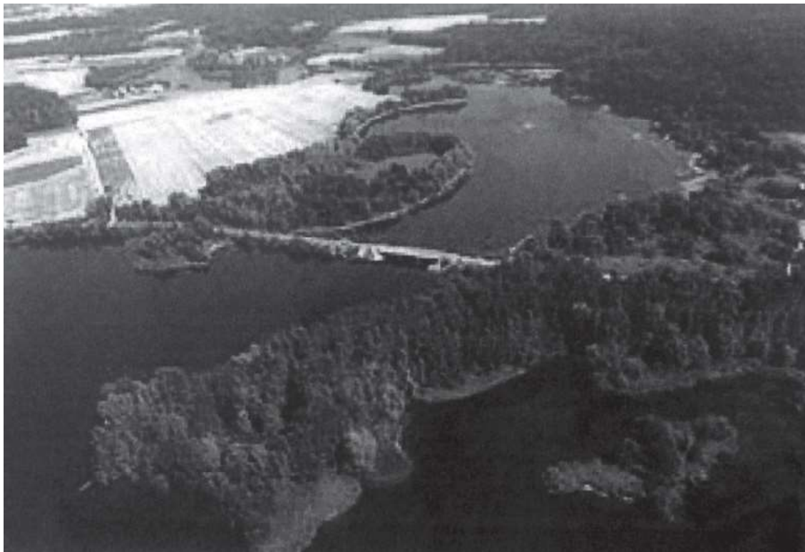
Widok rzeki Skrzywy Prawej