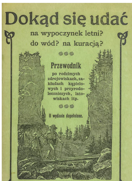
Фот. 2. Обкладинка другого видання путівника “Куди податися на літній відпочинок? На води? На оздоровлення?”, Берлін 1911