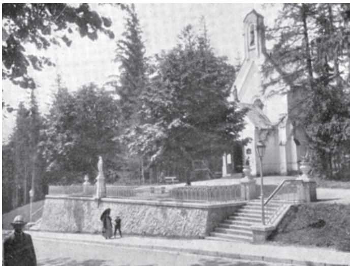
Фот. 5. Римо-католицький костел Вознесіння Пресвятої Диви Марії в Трускавці.