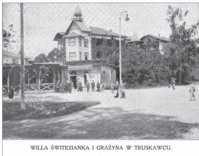
Фот. 4. Вілли „Світезянка” і „Гражина” в Трускавці.