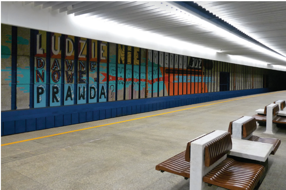
Il. 1. Mural „The Writers” na ścianie peronu 4 Dworca Centralnego w Warszawie