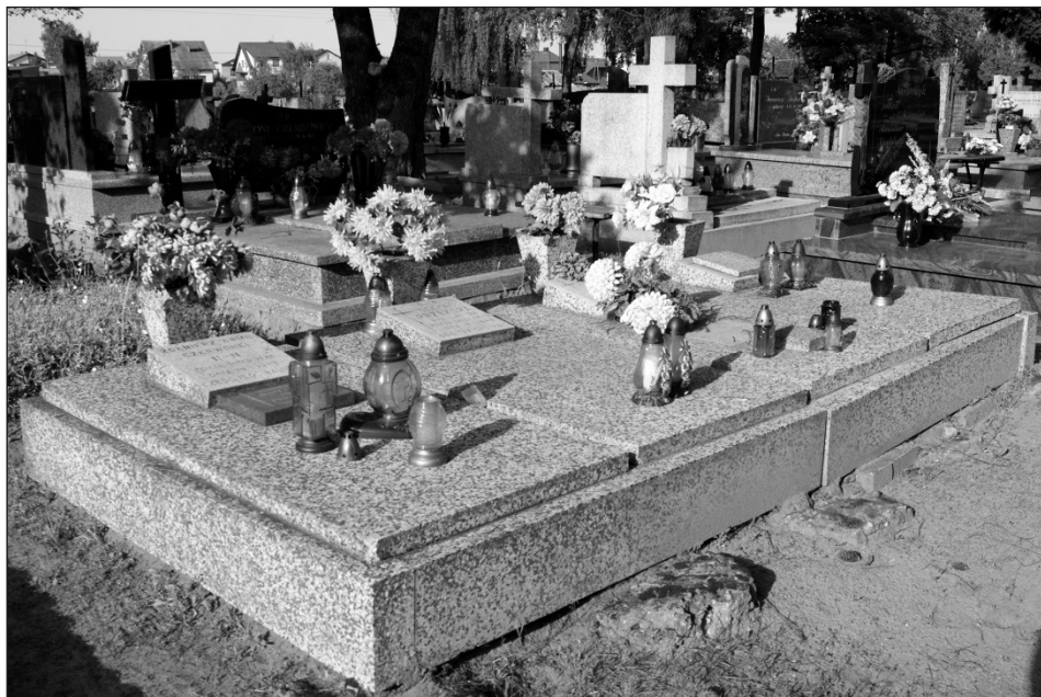
Fot. 7. Mogiła zbiorowa zabitych 20 stycznia 1945 r. w Kotlinkach na cmentarzu św. Wawrzyńca w Szadku Źródło: fot. Jarosław Stulczewski, maj 2013

miesiące, aby władza komunistyczna przejęła inicjatywę, dokonując zmian personalnych, a często także aresztując i mordując niewygodne z politycznego punktu widzenia osoby.