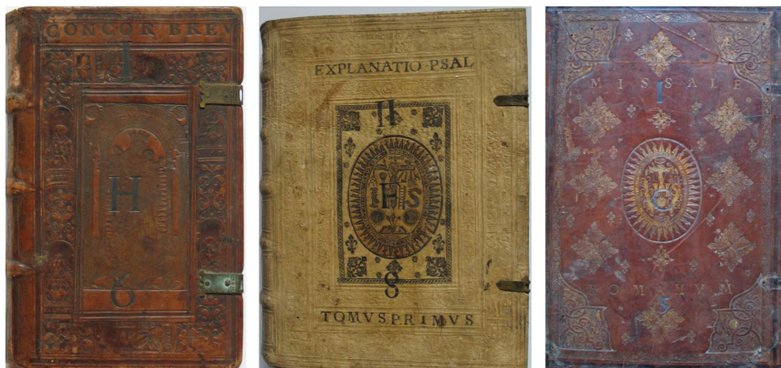
Fot. 3. Przykłady sygnatury topograficznej na egzemplarzach ze zbiorów Zabytkowej Biblioteki na Jasnej Górze w Częstochowie

Topograficzna adnotacja o miejscu w zbiorze wniknęła również w przestrzeń ekslibrisu. Przykład takiego rozwiązania stanowi historyczna kolekcja Oppersdorffów (fot. 4), w której występuje 9 wariantów ekslibrisów z określonym działem i miejscem na sygnaturę (Ściążko, 2017).