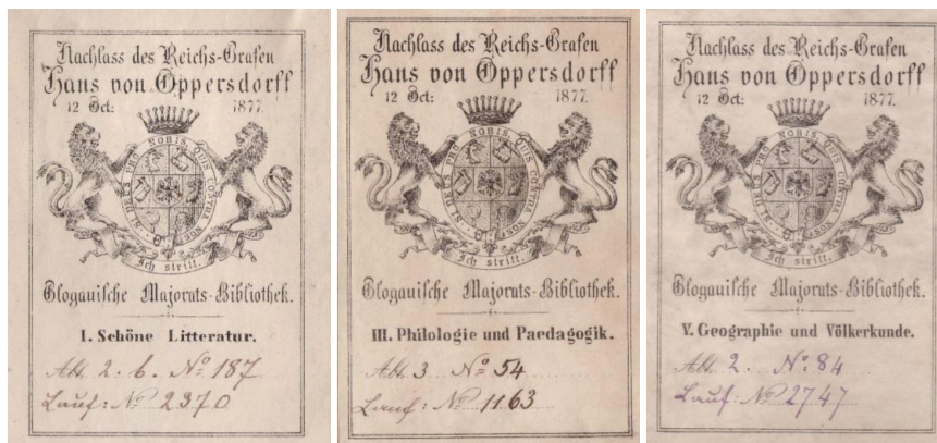
Fot. 4. Przykłady sygnatury topograficznej na ekslibrisach z kolekcji Oppersdorffów

Topograficzna adnotacja o miejscu w zbiorze wniknęła również w przestrzeń ekslibrisu. Przykład takiego rozwiązania stanowi historyczna kolekcja Oppersdorffów (fot. 4), w której występuje 9 wariantów ekslibrisów z określonym działem i miejscem na sygnaturę (Ściążko, 2017).