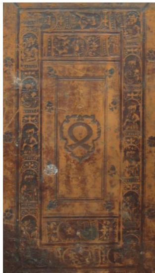
Fot. 2. Oprawa krakowska (fragment) z supereklibrisem anonima herbu Nałęcz, z pierwszej połowy XVI w. Ze zbiorów Zabytkowej Biblioteki na Jasnej Górze w Częstochowie