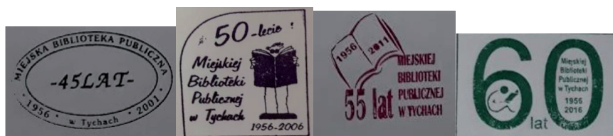
Fot. 6. Przykłady pieczęci okolicznościowych na zbiorach z kolekcji Miejskiej Biblioteki Publicznej w Tychach

Ostatnią czynnością odnoszącą się do sygnowania, a inicjowaną z poziomu biblioteki, jest stemplowanie pieczęcią wycofania czy też wydzielenia z kolekcji (fot. 7). Znak identyfikuje placówkę oraz określa relację wobec niej.