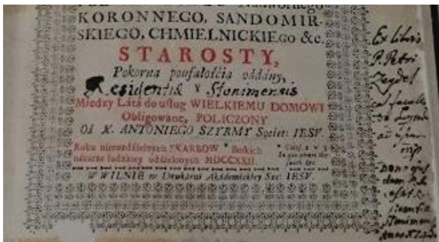
Fot. 1. Ekslibris Patris Petri Zeydel cum facultate superiorum adusum, manu propria. Dono eiusdem [...] zapis nieczytelny] Residentiae Slonimensis Anno 1745 1

na obiekty materialne nanoszono dość rzadko. Począwszy od XV w., w związku ze zmianami światopoglądowymi oraz z narodzinami sztuki typograficznej, wprowadzano je coraz chętniej, czego liczne przykłady odnajdziemy w książkach. Artyści, uświadomiwszy sobie nie tyle własną wartość, ile rolę społeczną, odnotowywali łacińskie formuły, np.: pinxit, p. – namalował; fecit, f. – wykonał; sculpsit, sc. – wyrzeźbił lub rysował; delineavit, del. – narysował; invenit, inv. – projektował itp. Łaciną zapisana jest również adnotacja, która na dobre zadomowiła się w przestrzeni książki, z tą różnicą, że nie odnosiła się do twórcy, lecz do osoby właściciela. Od tej pory jego imię i nazwisko poprzedzała łacińska formuła Ex libris , co oznacza: z książ / z księgozbioru (fot. 1).