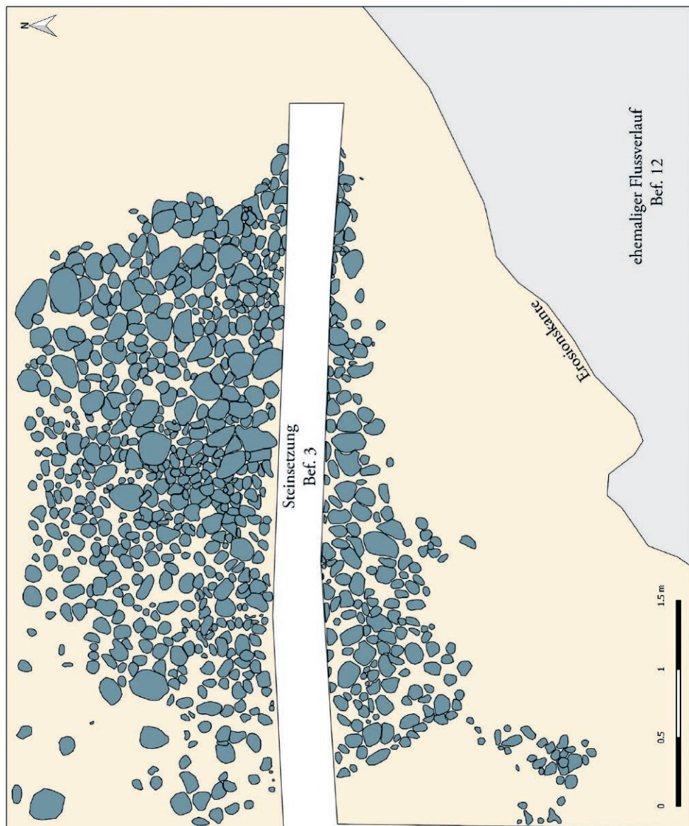
Abb. 2. Świelubie. Reste einer rechteckigen Steinsetzung (Bef. 3) im Grabungsschnitt 3. Grafik: S. Messal