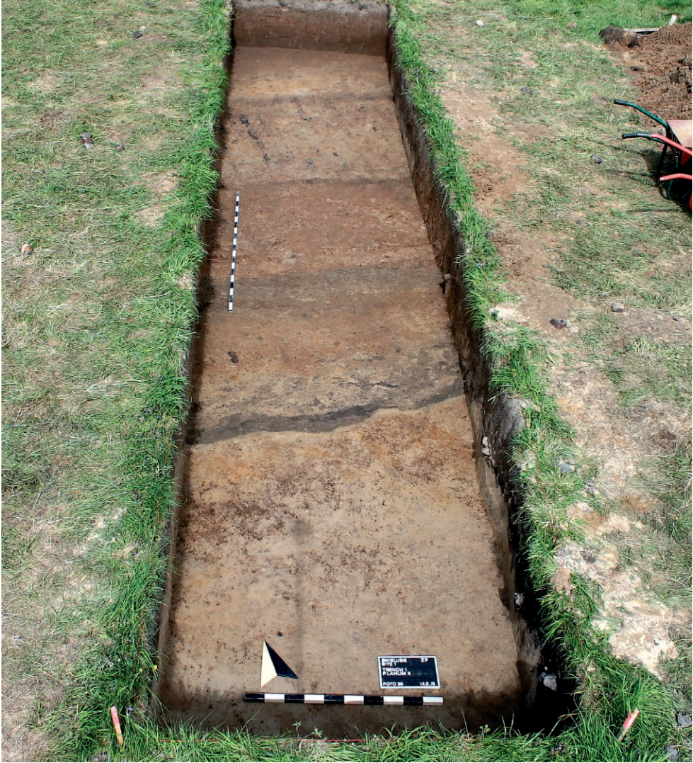
Abb. 3. Świelubie. Reste der Befestigungskonstruktion der Vorburgsiedlung im Grabungsschnitt 1.

Fig. 3. Świelubie, Dygowo commune (site 1). Remains of the earthwork of the settlement beyond stronghold walls in trench 1.