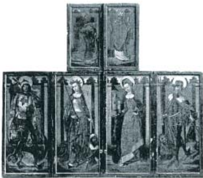
7. Rewersy retabulum Mistrza Widoku św. Guduli z Geel (ilustracja z: M. J. Friedländer, Early Netherländish Painting , t. IV, Leyden 1967).

Predella, do której montowano dół korpusu (w Niemczech południowych także całą nastawę) miała formę poziomego prostokąta, zbliżonego również do trapezu – z poszerzonymi bokami, nieraz o miękkich liniach 49 . Wielkość jej uzależniona była od rozmiarów retabulum, a także od warunków wnętrza, w którym miało ono przebywać. Podobnie jak reszta elementów ołtarza, występowała zarówno w postaci malowanej, jak i rzeźbionej – jako nisza z miejscem na figurki lub na zamykane pojedynczymi drzwiczkami szafki z komunikantami czy relikwiami. Pojawiały się też kombinacje rzeźbionych i malowanych części 50 . Malowane predelle przedstawiały rząd świętych, a także takie tematy, jak Kolegium Apostolskie , Chrystus w Grobie w asyście