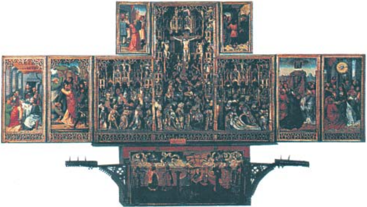
3. Retabulum z Pruszcza Gdańskiego. Przykład tzw. konstrukcji niderlandzkiej, z rzeźbioną częścią środkową, podwyższoną na osi, w kształcie odwróconej litery T (ilustracja z: Muzeum Narodowe w Warszawie. Przewodnik , red. K. Murawska-Muthesins, D. Folga-Januszewska).

3. Retabulum from Pruszcz Gdański. Example of the so-called Low Counties construction, with carved central part, raised on the axis, in the shape of an inverted letter T. Ill. from: Muzeum Narodowe w Warszawie. Przewodnik (National Museum in Warsaw. Guidebook), ed. by K. Murawska-Muthesins, D. Folga-Januszewska.