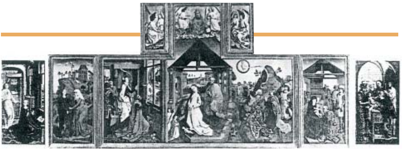
11. Retabulum Narodzin Chrystusa ze szkoły Rogiera van der Weyden. Pentaptyk z malowaną częścią środkową i przedstawieniem Narodzin Chrystusa w centrum (ilustracja z: M. J. Friedländer, Early Netherländish Painting , t. IV, Leyden 1967).