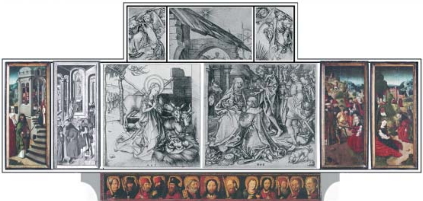
12. Wersja rekonstrukcji retabulum wróblewskiego z malowaną częścią środkową. W tym miejscu umieszczono sugerowane pierwowzory graficzne – ryciny Martina Schongauera: Narodziny Chrystusa , Pokłon Trzech Króli , Aniołowie . Ryciny pochodzą z: The Illustrated Bartsch 8 , vol. 6, (w:) Early German Artists , red. C. Hutchison, New York, 1980. Rekonstrukcję wykonała A. Ruskowska.

Trzech Króli przeważnie były połączone w obrębie jednej kwatery lub w części środkowej, przy czym Pokłon... zwykle zajmował większą powierzchnię obrazową niż Narodziny... i był wobec niego nadrzędny 66 . Predella, powtarzając charakter całości, była prawdopodobnie również malowana, a zwieńczenie polegałoby na uskokowo podniesionej górnej krawędzi części środkowej lub byłoby zawarte w obrębie tablicy. Od zwieńczenia uzależniona jest obecność mniejszych skrzydeł ulokowanych nad dolnymi kwatarami. Miałyby one bowiem rację bytu tylko wtedy, jeśli górna krawędź środkowej tablicy byłaby podwyższona na osi.