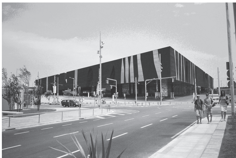
Fot. 5. Barcelona – Forum 2004 (Jacques Herzog & Pierre de Meuron).

Rewitalizacja ziemi niczyjej sprzyja natomiast oddolnej budowie zbiorowego kapitału społecznego, który potrzebuje innowacji, nie konserwacji. „Akupunktura”, nakłuwanie punktów słabnących powiązań – tak swoją odpowiedź na rozpad i fragmentację przestrzeni miejskich nazywa Herzog. Ożywiając interakcje, wprowadzając nowe funkcje, krzyżując punkty widzenia, uzyskuje się jednocześnie efekty urbanistyczne i społeczne. Dokonywanie zmian, przymus innowacji, nowa prostota, niezwykle materiały sprawiają, że form follows function/fiction , a fragmenty miasta układają się w opowieść, z której nie muszą zostać wykluczeni jego rdzenni mieszkańcy.