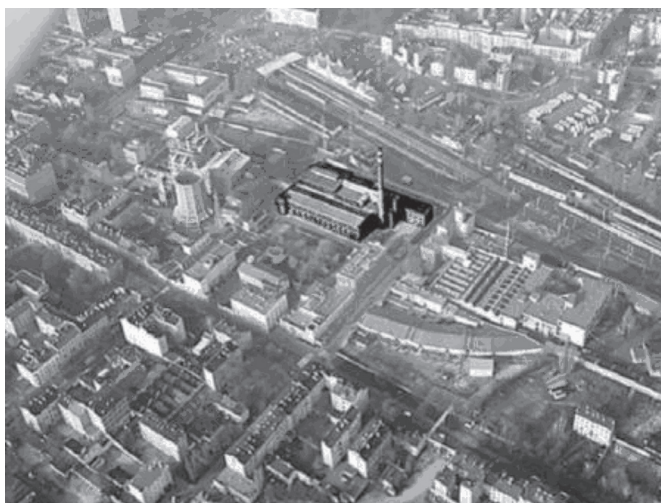
Fot. 1. Fragment starego centrum Łodzi

Czym innym są natomiast próby przywracania połączeń między izolowanymi fragmentami miast, które jednak rzadko mają na względzie łączenie porządku przestrzennego z ładem społecznym. Ich zadaniem jest wprowadzenie życia do fragmentów chorych lub obumarłych, z nadzieją, że wytworzy się wówczas nowa zasada segregacji, bardziej dostosowana do mechanizmów dominującej kultury konsumpcyjnej. Ta zasada zaciera bowiem dychotomię: swoje–obce, kamuflując jednocześnie polityczne mechanizmy wykluczenia. Scalanie miasta wokół kreowanych przestrzeni bardzo często opisuje się, wykorzystując organiczną metaforę, o której była mowa. Zapewne dlatego także, ponieważ budzi dobre, sprzyjające przyjęciu nawet najbardziej radykalnych projektów skojarzenia, wykreowane przez antropocentryzm.