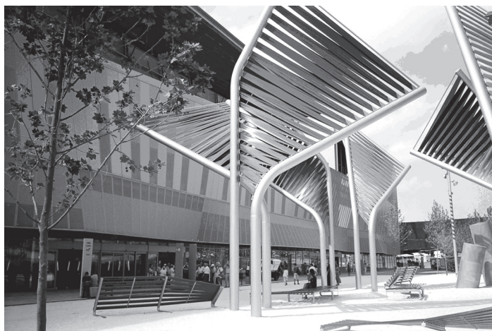
Fot. 4. Barcelona – tereny wokół Forum 2004 po rewitalizacji

Strategia modernizacji – przeciwnie – odnajduje martwe fragmenty miasta, nienależące do nikogo terrain vague i usiłuje je wypełnić życiem odświeżonym, publicznym, międzynarodowym w nadziei, że będą one przekazywały energię okolicznym mieszkańcom. Dobre życie nie da się bowiem zaprojektować, uporządkować w bloki, pozszywać z fragmentów na nowo posegregowanych.