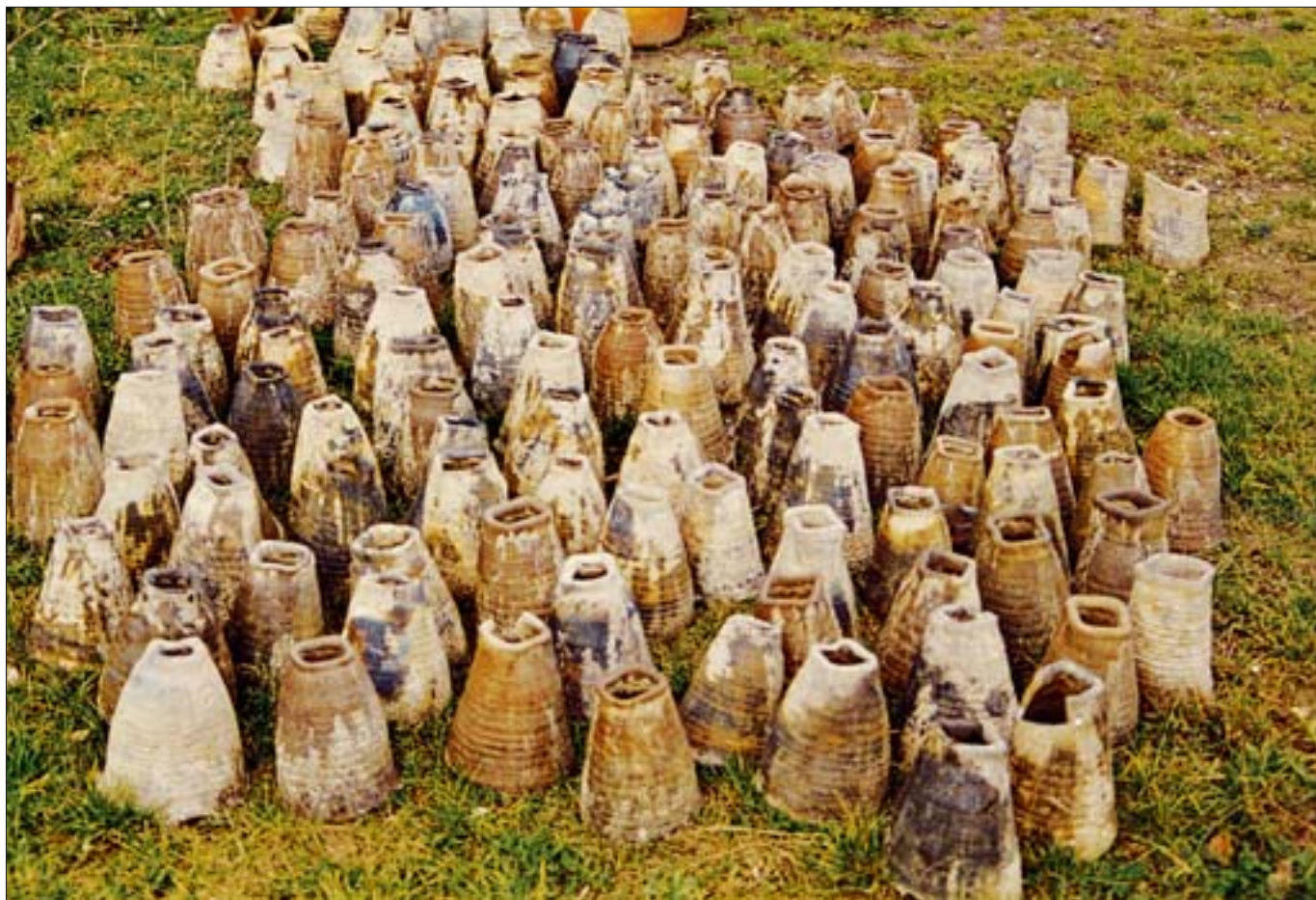
9. Stanowisko II, wykop 8b. Naczynia „izolacyjne” po demontażu. 9. Site II, dig 8b. “Insulation” vessels after disassembly.

Wprawdzie stosowanie wyrobów ceramicznych w charakterze warstwy izolacyjnej znane było już w pierwszych wiekach naszej ery i stosowane na terenie imperium rzymskiego, jednakże na ogół używano w tym celu potłuczonych i zniszczonych naczyń, rozbijając je na drobniejsze fragmenty i utwardzając nimi podłoże pod zabudowę lub pod nawierzchnię drogi. W trakcie poszukiwań analogii do znaleziska z Nidzicy natrafiono na wyniki badań archeologicznych prowadzonych w latach 1961 i 1963 w Sieklukach, pow. białobrzeski, woj. mazowieckie 5 , oraz w mieście Münchsmünster, na północ od Monachium, które miały miejsce w latach 1992-1993 6 . W obu przypadkach izolację stanowiły odwrócone do góry dnem zarówno kafle miskowe (Münchsmünster), jak i garnkowe (Siekluki). Również Jacek Wysocki podczas pobytu w południowej Francji natrafił w ruinach antycznego miasta Vienne, na południe od Lyonu, na podobną izolację, tym razem wykonaną z dużych naczyń zasobowych (około 50 cm wysokości), pełniących, podobnie jak w dwóch wcześniejszych przypadkach, zupełnie odmienną funkcję niż ta, do której je pierwotnie przeznaczono 7 . Ten właśnie fakt zasadniczo różni znalezisko z Nidzicy od trzech