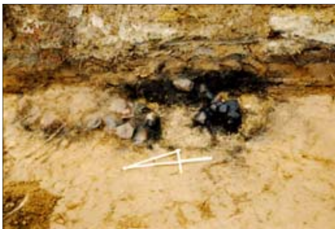
5. Stanowisko II, wykop 8b. Obiekt V, palenisko z fragmentami naczyń przeworskich (grupa nidzicka). 5. Site II, dig 8b. Object V, hearth with fragments of Przeworsk culture (Nidzica group) vessels.

Niewątpliwie najciekawszym elementem, który wystąpił w obrębie IV poziomu stratygraficznego, była izolacja średniowiecznego budynku wykonana z lepionych na kole garnków. Otóż na głębokości nieprzekraczającej 2 m natrafiono na bruk kamienny ułożony na podsypce z piasku. Bruk ten, wykonany z niewielkich polnych kamieni, stanowił z pewnością posadzkę w piwnicy budynku. Po jego usunięciu oraz zalegającej pod nim podsypki natrafiono na warstwę naczyń odwróconych do góry dnem (il. 8). Naczynia te ułożone zostały ciasno jedno obok drugiego, a przestrzeń między nimi wypełniono gliną. W ten sposób uzyskano niemalże idealnie płaską i stabilną podwalinę, stanowiącą doskonałą izolację wzniesionego tu budynku (il. 1).