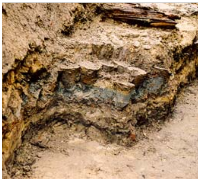
10. Stanowisko II, wykop 8b. Fragment profilu północnego i zachodniego ukazujący sposób wykonania izolacji ceramicznej. 10. Site II, dig 8b. Fragment of the northern and western profile showing the method of making the pottery insulation.

Wprawdzie stosowanie wyrobów ceramicznych w charakterze warstwy izolacyjnej znane było już w pierwszych wiekach naszej ery i stosowane na terenie imperium rzymskiego, jednakże na ogół używano w tym celu potłuczonych i zniszczonych naczyń, rozbijając je na drobniejsze fragmenty i utwardzając nimi podłoże pod zabudowę lub pod nawierzchnię drogi. W trakcie poszukiwań analogii do znaleziska z Nidzicy natrafiono na wyniki badań archeologicznych prowadzonych w latach 1961 i 1963 w Sieklukach, pow. białobrzeski, woj. mazowieckie 5 , oraz w mieście Münchsmünster, na północ od Monachium, które miały miejsce w latach 1992-1993 6 . W obu przypadkach izolację stanowiły odwrócone do góry dnem zarówno kafle miskowe (Münchsmünster), jak i garnkowe (Siekluki). Również Jacek Wysocki podczas pobytu w południowej Francji natrafił w ruinach antycznego miasta Vienne, na południe od Lyonu, na podobną izolację, tym razem wykonaną z dużych naczyń zasobowych (około 50 cm wysokości), pełniących, podobnie jak w dwóch wcześniejszych przypadkach, zupełnie odmienną funkcję niż ta, do której je pierwotnie przeznaczono 7 . Ten właśnie fakt zasadniczo różni znalezisko z Nidzicy od trzech