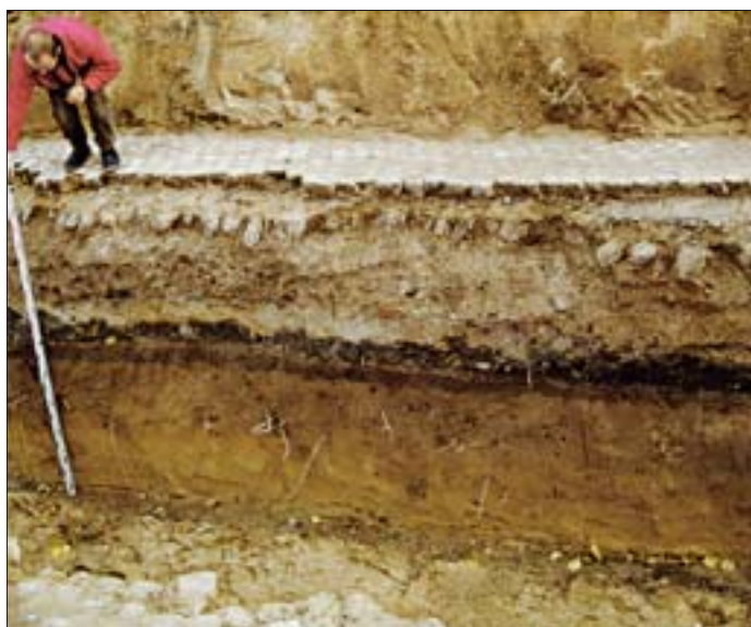
4. Stanowisko II, wykop 8b. Zachowany układ stratygraficzny. W stropie warstwa późnośredniowieczna (ciemnoszara ziemia), w spągu warstwa halsztacko-lateńska (jasnobrunatna piaszczysta ziemia).