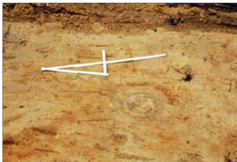
7. Stanowisko II, wykop 8b. Negatyw pala poniżej halsztacko-lateńskiej warstwy kulturowej. 7. Site II, dig 8b. Negative of a post underneath the Hallstatt-La Tene culture layer.

bliżeniu przypominał kwadrat bądź romb (il. 9). Jednakże największe zainteresowanie archeologów wzbudziły dna naczyń, których zadaniem było stworzenie swego rodzaju posadzki. Chodzi mianowicie o ich grubość, która niejednokrotnie sięgała nawet 2,5 cm. Ani znane z tego okresu naczynia pełniące funkcję zastawy stołowej lub kuchennej, ani też kafle typu garnkowego lub miskowego występujące na terenie pn.-wsch. Polski nie miały den o takiej grubości. Fakt ten zadecydował m.in. o odrzuceniu hipotezy, która pozwoliłaby zinterpretować znalezisko jako skład naczyń lub kafli, a jednocześnie stał się podstawą stwierdzenia, że naczynia te stanowiły zaskakujący rodzaj izolacji budynku od niekorzystnych oddziaływań środowiska.