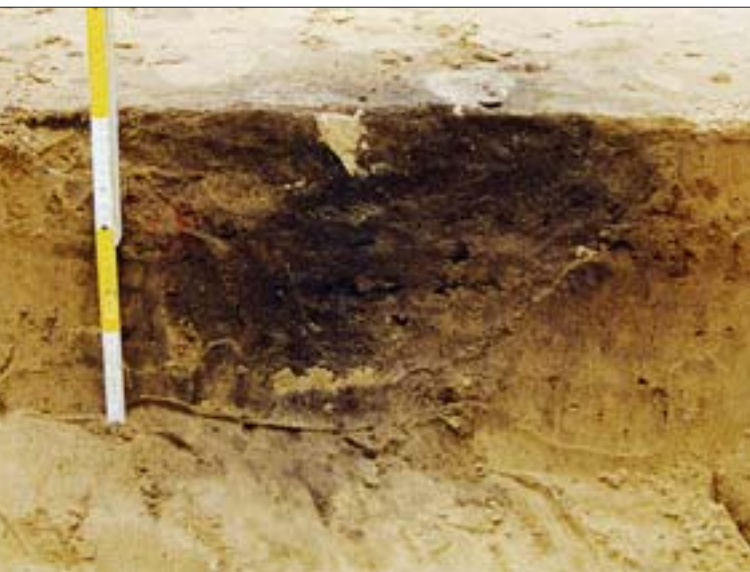
3. Stanowisko II, wykop 8b. Obiekt III, przekrój. 3. Site II, dig 8b. Object III, section.