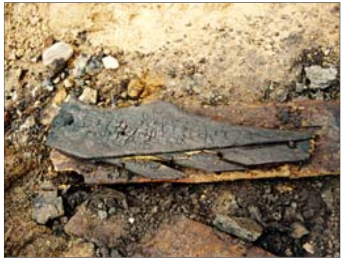
12. Stanowisko II, wykop 8b. Drewniany element konstrukcyjny budynku. 12. Site II, dig 8b. Wooden construction element of the building.

Odrębną kwestię stanowi problem ekspozycji znaleziska. Dzięki porozumieniu między Warmińsko-Mazurskim Wojewódzkim Konserwatorem Zabytków a muzeum na zamku w Nidzicy oraz dzięki wydatnej pomocy pracowników Wojewódzkiego Urzędu Ochrony Zabytków w Olsztynie udało się odtworzyć niewielki fragment izolacji. Niestety, mimo wykonania bardzo precyzyjnej rekonstrukcji, forma ekspozycji w zamkniętej gablocie (il. 14) jest dla zwiedzających mało czytelna i nie oddaje w pełni przeznaczenia,