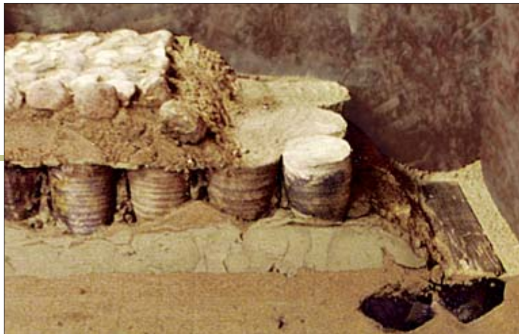
14. Stanowisko II, wykop 8b. Ekspozycja w salach wystawowych zamku w Nidzicy ukazująca sposób izolacji budynku od podłoża przy użyciu tzw. garnków „izolacyjnych”.