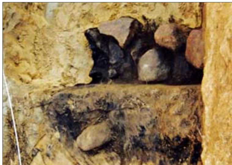
6. Stanowisko II, wykop 8b. Obiekt VI, palenisko w trakcie eksploatacji. 6. Site II, dig 8b. Object VI, hearth in the course of exploration.

Naczynia przypominały swym kształtem wysmukłe ścięte stożki, przy czym część z nich miała ściany czerepu lekko wklęsłe, a część wypukłe. Zapewne sprzyjało to lepszemu wpasowaniu się poszczególnych egzemplarzy, aby mogła zostać utworzona w miarę jednolita i stabilna powierzchnia. Ściany wszystkich garnków miały pokarbowaną powierzchnię, zapewne w celu uzyskania lepszej przyczepności glinianego spoiwa. Wysokość naczyń wahała się od 15 do 21 cm, a średnica dna wynosiła od 13 do 17 cm. We wszystkich przypadkach średnica wylewu była zdecydowanie mniejsza od średnicy dna. Wszystkie wylewy cechowała też znacznie pogrubiona i zaokrąglona krawędź, a ich kształt w przy-