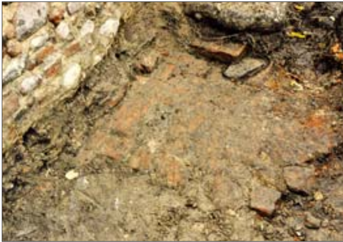
11. Stanowisko II, wykop 8b. Fragment ceglanej posadzki piwnicy, pod którą znajdowała się izolacja z naczyń ceramicznych. 11. Site II, dig 8b. Fragment of the brick cellar floor above the pottery insulation.

opisanych wcześniej. Nidzickie garnki pełniły bez wątpienia rolę li tylko izolacji. Z całą pewnością ani ich kształt, ani też pozostałe cechy morfologiczne (grubość dna, średnica wylewu, brak ornamentu) nie dają podstaw do kojarzenia ich z żadną inną funkcją.