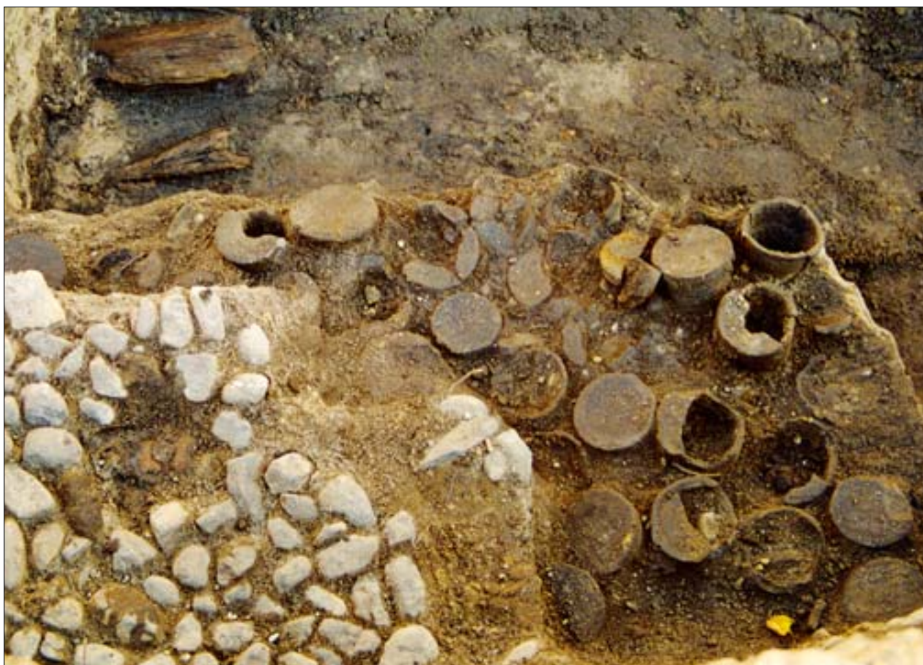
8. Stanowisko II, wykop 8b. Widok z góry na bruk kamienny oraz znajdującą się pod nim izolację wykonaną z naczyń ceramicznych. 8. Site II, dig 8b. View from above of the stone pavement and the pottery insulation underneath it.

Opisana tu izolacja jest znaleziskiem zupełnie niezwykłym, zarówno w skali Polski, jak i Europy.