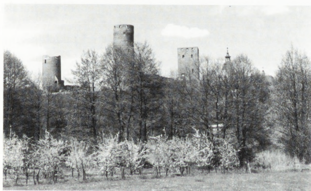
1. Sady owocowe i winorośla stanowią potencjalny kierunek rozwoju rolnictwa ekologicznego w okolicach Czerska. Dobre nasłonecznienie istniejące na czerskiej skarpie stwarza warunki do uprawy winorośli i produkcji win na małą skalę.

Położenie sołectwa czerskiego w całości na obszarach chronionego krajobrazu, zatwierdzonego przez wojewodę w 1997 r., implikuje jego rozwój przestrzenny, społeczny i gospodarczy według zasad ekorozwoju, umożliwiającego takie gospodarowanie środowiskiem, aby nie doprowadzać do niszczenia jego walorów i zasobów. Poprzez ekorozwój realizuje się model godnego życia nie kosztem przyrody, ale w zgodzie z nią, wpływając na twórcze działania społeczności lokalnych, które chcą zachować nienaruszone środowisko dla następnych pokoleń.