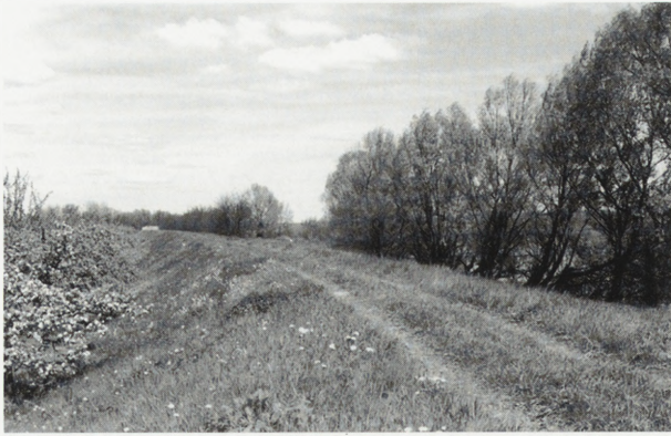
3. Dzięki zrealizowanej trasie rowerowej z Warszawy do Czerska zapewniony zostanie bezpieczny, rekreacyjny dojazd w malownicze okolice Czerska

3. A Warsaw–Czersk bicycle route will guarantee a safe journey to the picturesque regions of Czersk