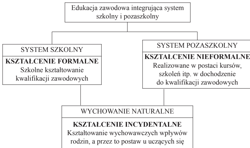
Rys. 4. Model edukacji zawodowej w integracji kształcenia formalnego, pozaformalnego i incydentalnego (Baraniak 86 , model własny)

Inny model edukacji zawodowej, oparty również na integracji, ale kształcenia formalnego, nieformalnego i incydentalnego, można wyprowadzić z koncepcji S.M. Kwiatkowskiego 85 , co ilustruje rysunek 4.