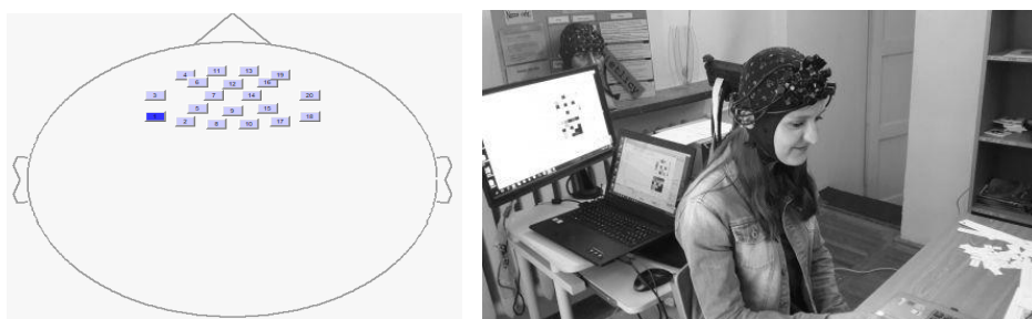
Rysunki 1 i 2. Rozmieszczenie detektorów na schemacie i osobie badanej

Badano jedynie obszar kory przedczołowej.