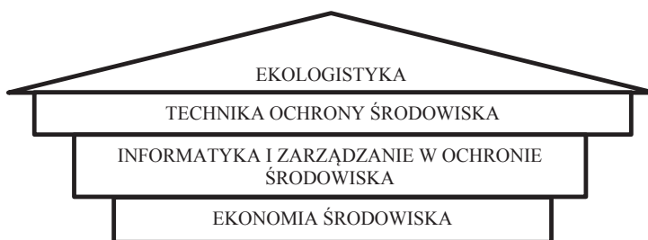
Rys. 3. Główne filary ekologii

Trzy filary ekologii zaprezentowane zostały na rys. 3.