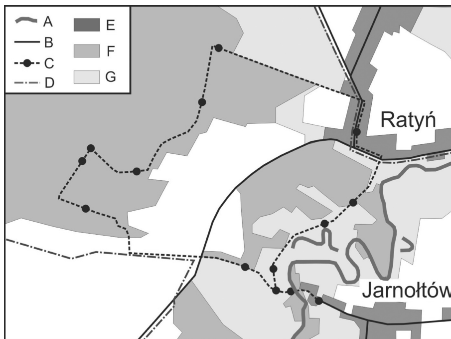
Rys. 3. Ścieżka przyrodniczo-edukacyjna Jarnołtów-Ratyń

A – rzeka Bystrzyca, B – drogi, C – ścieżka przyrodniczo-edukacyjna wraz ze stanowiskami, D – granica Parku Krajobrazowego Dolina Bystrzycy, E – zabudowania, F – lasy, G – łąki i pastwiska