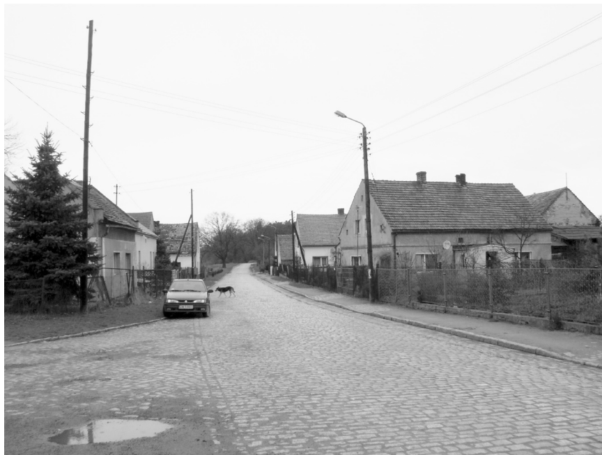
Fot. 2. Rędzin, ul. Wędkarzy