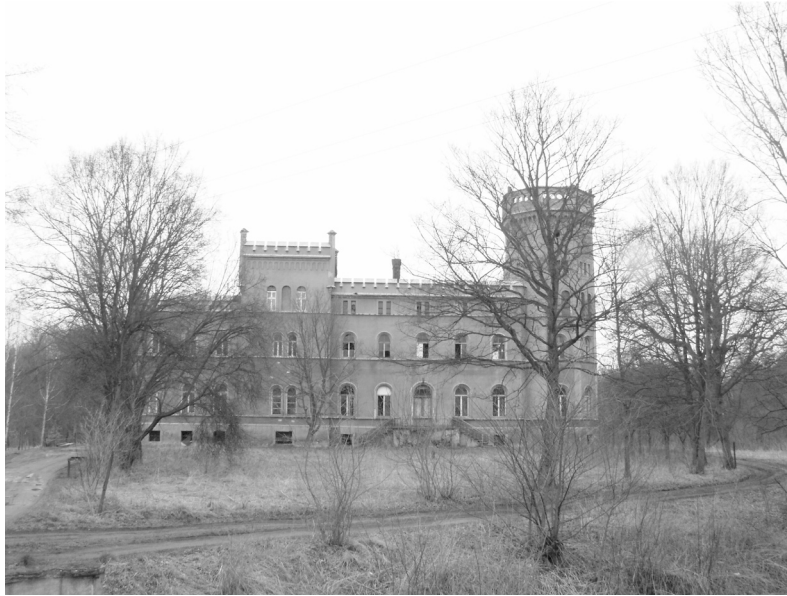
Fot. 5. Pałac Stolbergów w Świniarach