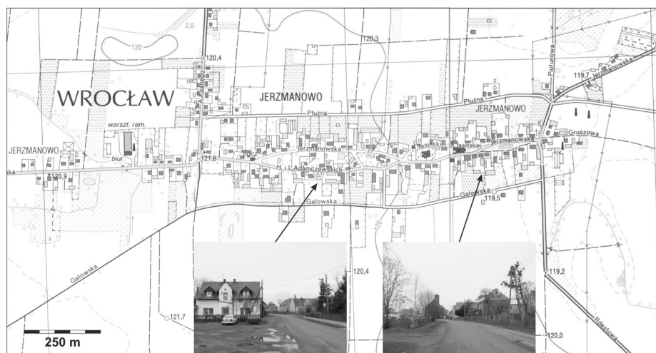
Rys. 2. Układ przestrzenny i fizjonomia osiedla Jerzmanowo