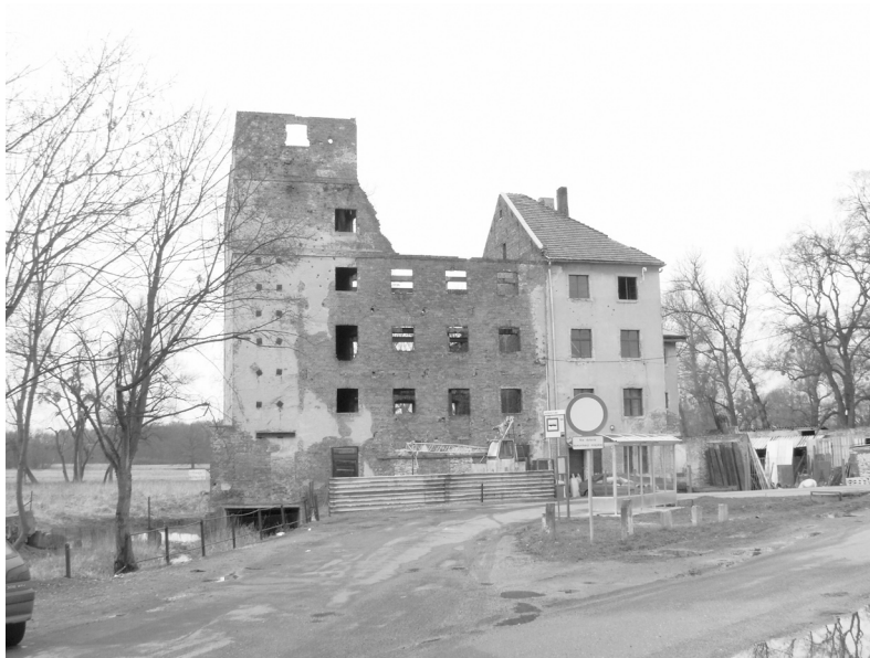
Fot. 6. Dawny młyn w Jarnołtowie