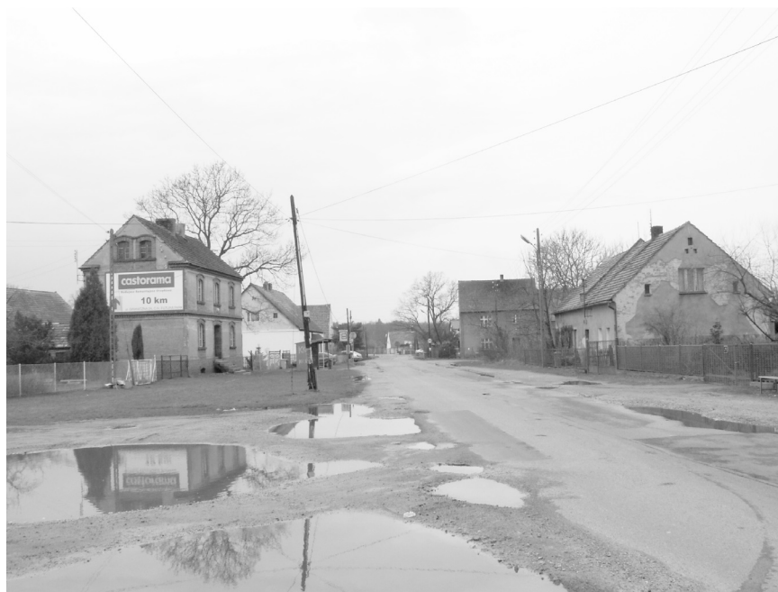
Fot. 1. Marszowice, ul. Marszowicka