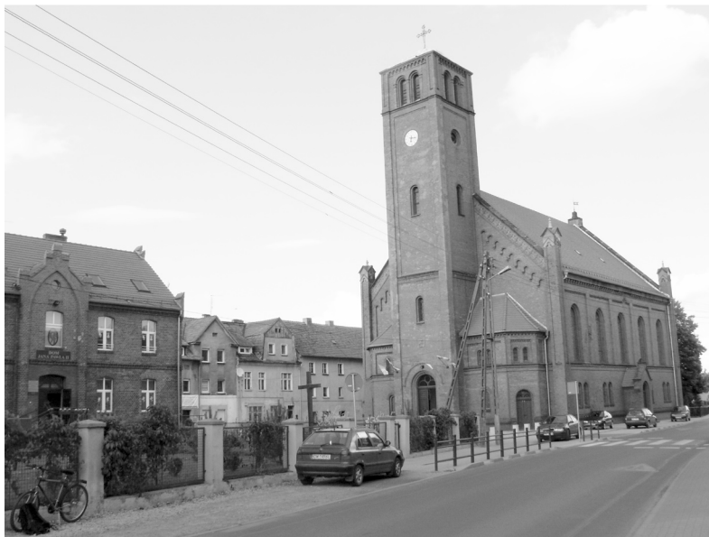
Fot. 3. Dawny kościół ewangelicki w Jerzmanowie