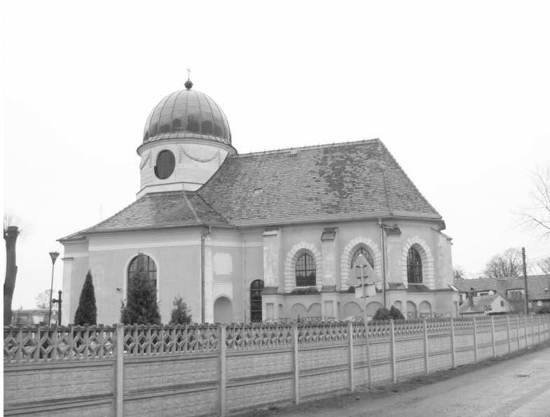
Fot. 4. Kościół św. Anny w Praczach Widawskich