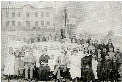
Nauczyciele i uczniowie szkoły w Rybarzowicach 1910/1911.