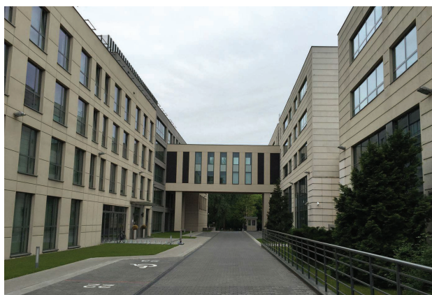
Il. 5. Sąd Gospodarczy przy ul. Czerniakowskiej w Warszawie (fot. K. Piętka-Rakowiecka, 2015)

Fig. 5. Commercial Court on Czerniakowska Street in Warsaw (photo by K. Piętka-Rakowiecka, 2015)