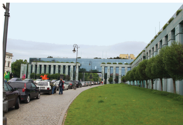
Il. 6. Budynek Sądu Najwyższego przy placu Krasieńskich w Warszawie (fot. K. Piętka-Rakowiecka, 2015)

Fig. 5. Commercial Court on Czerniakowska Street in Warsaw (photo by K. Piętka-Rakowiecka, 2015)