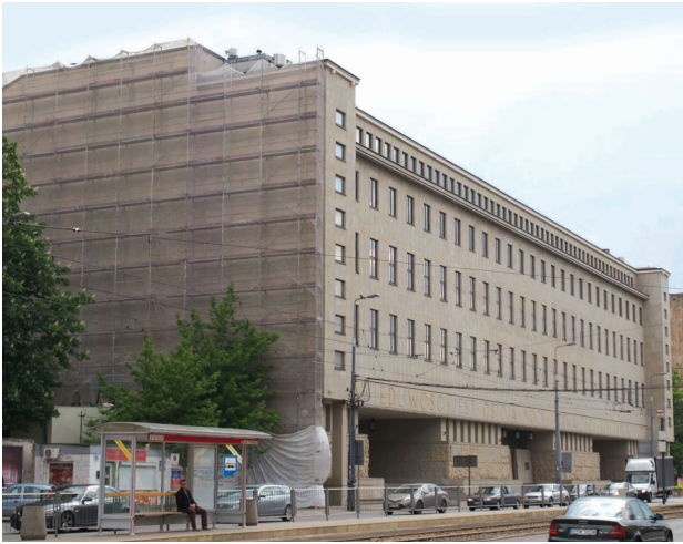
Il. 2. Sąd przy al. Solidarności w Warszawie