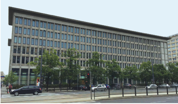
Il. 4. Budynek sądu przy ul. Marszałkowskiej 82 (fot. K. Piętka-Rakowiecka, 2015)