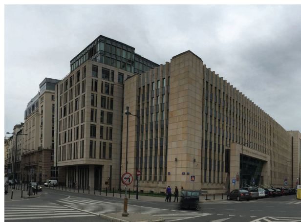
Il. 9. Budynek Naczelnego Sądu Administracyjnego w Warszawie

W latach 2006–2009 trwały prace nad rozbudową – według projektu warszawskiej pracowni S.A.M.I. – o nową część mieszczącą Wojewódzki Sąd Administracyjny [12]. Budynek liczy ponad 9500 m 2 powierzchni użytkowej. Kubaturę tworzą trzy bryły, jedna pięciokondygnacyjna i dwie dziewięciokondygnacyjne. Wejście główne do obiektu zlokalizowane jest od ul. Boduena. Forma kolumnady zwieńczonej napisem wrytym w kamieniu bezpośrednio nawiązuje do gmachu Sądu Grodzkiego przy al. Solidarności. Projektanci w ten sposób opisują architekturę budynku: Dwie ostatnie kondygnacje budynku wycofano do łoża dwukondygnacyjnej bazy i wykończono fasadami przeszklonymi z kamiennymi i szklanymi aplikacjami. Budynek od strony ulicy Jasnej i Boduena ukształtowano w linii przebiegu pierzei ulicy. Od strony ulicy Szpitalnej, wysuwająca się bryła zamyka swym widokiem Plac Powstańców Warszawy [13]. Nowo powstała część sądu niczym się nie wyróżnia na tle innych budynków. Jest poprawna, ale nie porywająca (il. 9). Wpisuje się w kontekst, jednak nie niesie ze sobą żadnej