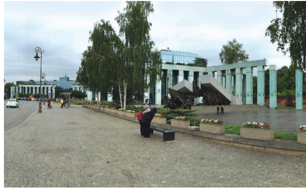
Il. 8. Pomnik Powstania Warszawskiego został podkreślony przez zastosowanie kolumnady. Warto zwrócić uwagę na kontrast kolorystyczny między budynkiem sądu a rzeźbą