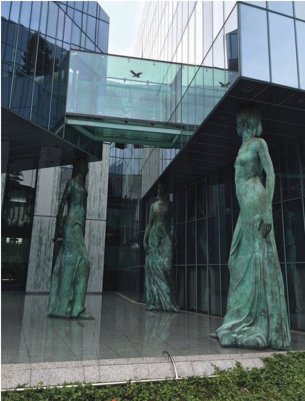
Il. 7. Kariatydy widoczne od strony ul. Nowiniarskiej