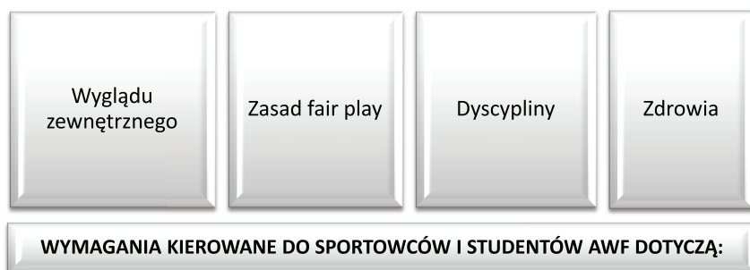
Rysunek 2. Spotykane najczęściej wśród sportowców i studentów kierunku sport i wychowanie fizyczne wymagania

Wymagania i pouczenia, jakie dominują w środowisku sportowym, są wartościami cenionymi także poza światem sportu i stanowią cel i kierunek rozwoju moralnego, społecznego, osobowego ludzi poważnie traktujących swój rozwój – indywidualny wzrost ku wyznaczonym ideałom. Podejście do kwestii