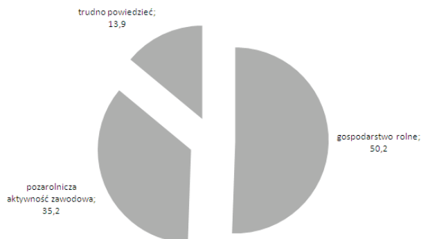
WYKRES 2. Preferencje badanych: praca w gospodarstwie rolnym czy aktywność pozarolnicza (w %) N=271

Deklarowane wyżej przez rolników strategie rozwojowe dobrze wkomponują się w opinie o dzisiejszej wsi ogółu jej mieszkańców. Oto częste wyróżniki wsi (maksimum cztery wskazania) w opiniach wybranej grupy mieszkańców ziemi sieradzkiej 25 :