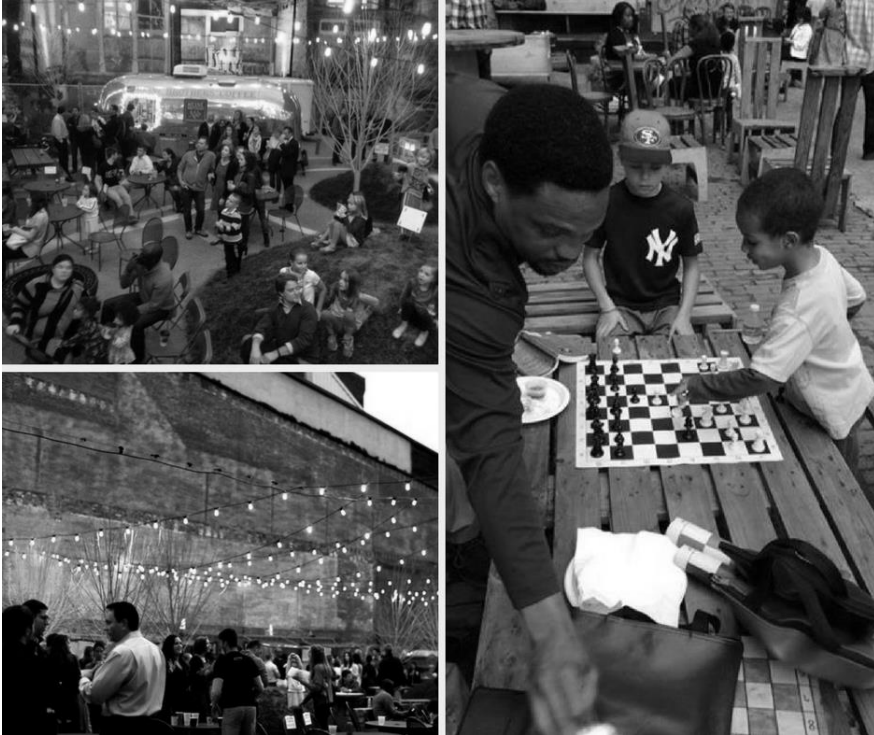
Rysunek 1. Ilustracja prezentująca inicjatywę miejską w Louisville.