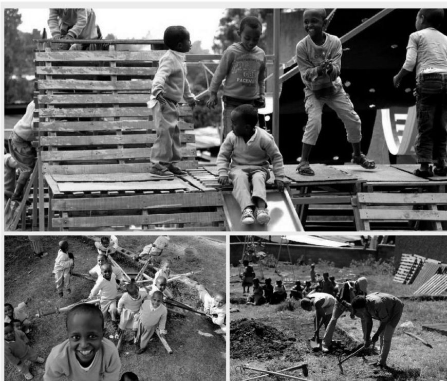
Rysunek 3. Plac zabaw zaprojektowany na terenie sierocińca w Etiopii.