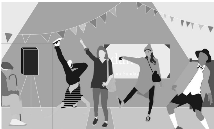
Rysunek 2. Inicjatywa taneczna Dance-O-Mat.

Projekt LQC stara się podejmować działania pomimo braku dostępnych środków na poprawę przestrzeni publicznej. Partycypacyjny i wspólnotowy charakter projektów to ostatni z czynników. Źródła finansowania mogą pochodzić z kampanii crowdsourcingowych, programów rządowych ukierunkowanych na działania kulturowe, prywatnych instytucji oraz fundacji, jak również firm usytuowanych w pobliżu działki.