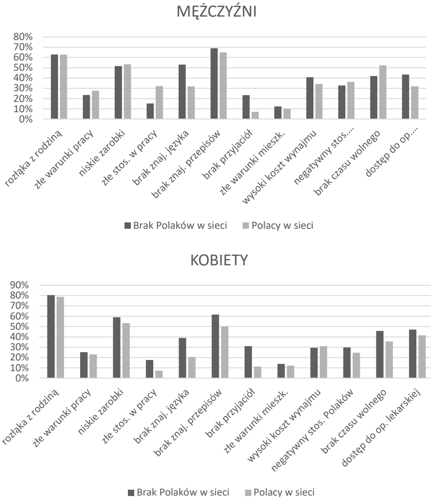
Rysunek 3. Migranci i migrantki według wskazanych problemów dnia codziennego i faktu posiadania więzi z Polakami (% respondentów 1 )

Uwagi. 1 Podstawy procentowania to wyróżnione w analizie grupy: mężczyźni posiadający więzi z Polakami i ich nie posiadający (lewy rysunek) oraz kobiety posiadające więzi z Polakami i ich nie posiadające (prawy rysunek).