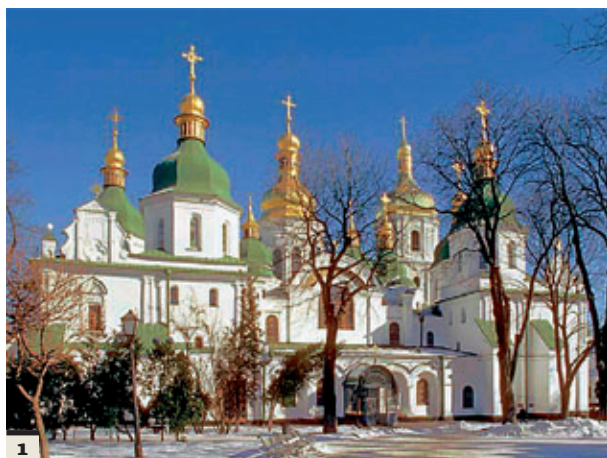
1. Sobór św. Sofii w Kijowie. 1. Saint Sophia Cathedral in Kiev.

2. Zespół cerkiewny św. Sofii Kijowskiej. Przemieszczanie elementów budowli pod wpływem statycznych oraz dynamicznych (sejsmicznych) obciążeń, 2007 r. Badania Narodowego Rezerwatu Historyczno-Architektonicznego „Sofia Kijowska”