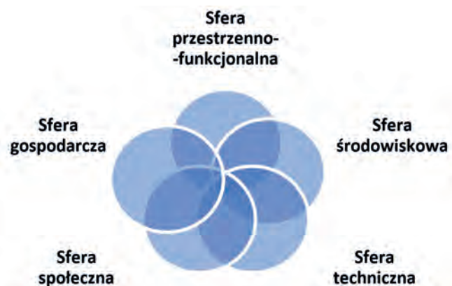
Ryc. 3. Sfery uwzględnione w diagnozie sporządzonej w programach rewitalizacyjnych

(centralny – GUS i wojewódzkie – WUS. Dane pozyskuje się również z obligatoryjnych, jak i fakultatywnych dokumentów sporządzanych w danej jednostce samorządowej oraz innych podmiotach administracji publicznej. Dla zapewnienia kompleksowości, obiektywizacji oraz rzetelności diagnozę w programach rewitalizacji wykonuje się w odniesieniu do pięciu sfer: społecznej, gospodarczej, przestrzenno-funkcjonalnej, technicznej i środowiskowej (ryc. 3). W efekcie ma ona dać pełny obraz sytuacji w danej jednostce terytorialnej oraz wskazać zjawiska kryzysowe oraz obszary koncentracji przestrzennej negatywnych zjawisk.