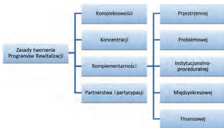
Ryc. 1. Zasady przygotowywania Programów Rewitalizacji