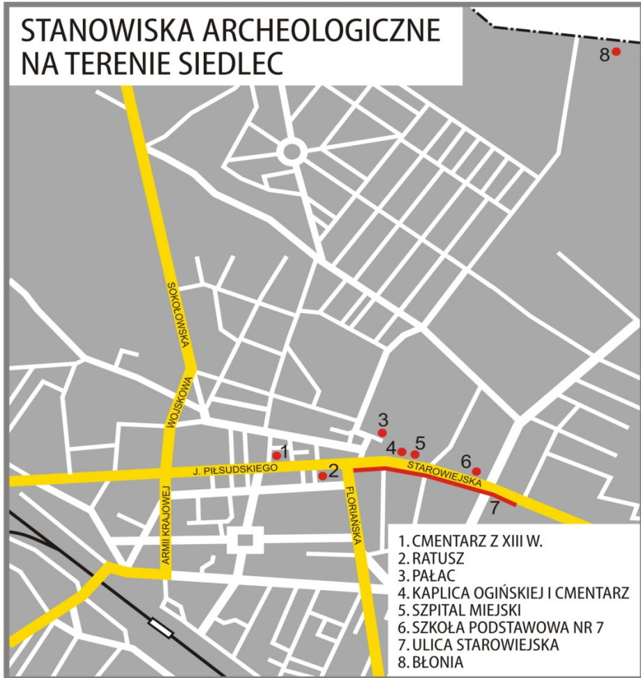
Mapa 2. opracował W. Florczykiewicz