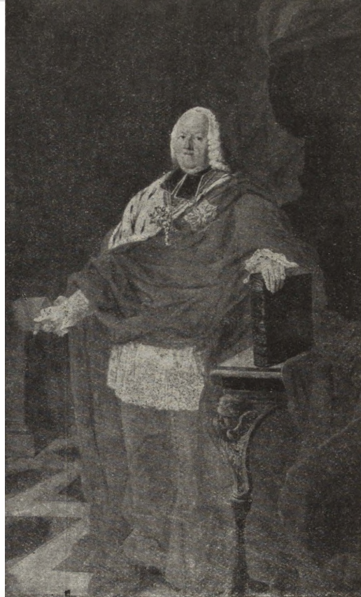
Ryc. 243 i 244. Portret prymasa Komorowskiego z w. XVIII w kolegiacie w Łowiczu przed i po konserwacji

na terenie województwa o dobrze zachowanych partiach muru o ciosowym wątku romańskim z XI w. została poddana w latach 1952–53 gruntownym zabiegom konserwatorskim, polegającym na usunięciu całkowicie zmuszającego stropu drewnianego a założeniu nowych stropów ogniotrwałych i dekoracyjnego drewnianego. Ponadto częściowo wymieniono i wzmocniono więzanie dachowe. Całość prac wykonano bez odsłonięcia dachu.