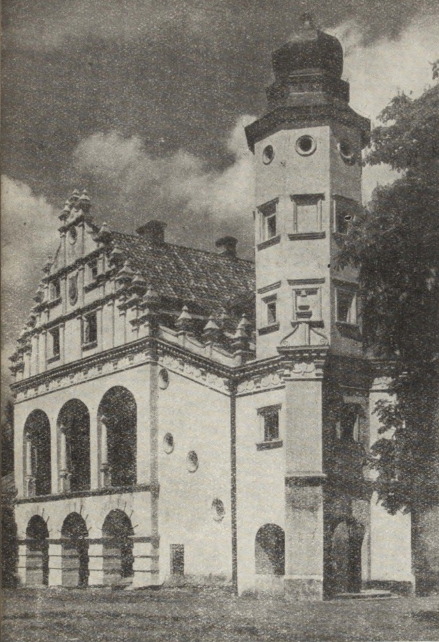
Ryc. 234 i 235. Dwór renesansowy w Poddębicach. Widok ogólny i loggia I piętra. Stan w r. 1955.

świadczenia w zakresie zagadnień konserwatorskich pozwala żywić nadzieję, że w niedalekiej przyszłości wszystkie ważniejsze roboty konserwatorskie będą wykonywane przez przedsiębiorstwo specjalizujące się w tej dziedzinie i zniknie potrzeba korzystania z usług różnych przygodnych przedsiębiorstw remontowo-budowlanych.