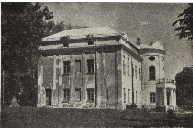
Ryc. 242. Gmach pomisonajski w Łowiczu. Stan w r. 1954.