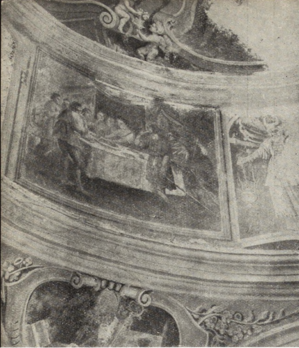
Ryc. 245. Fragment polichromii w kaplicy Lipskich w kolegiacie w Łowiczu.

Łyskorni pow. Wieluń oraz Węglewicach pow. Wieruszów.