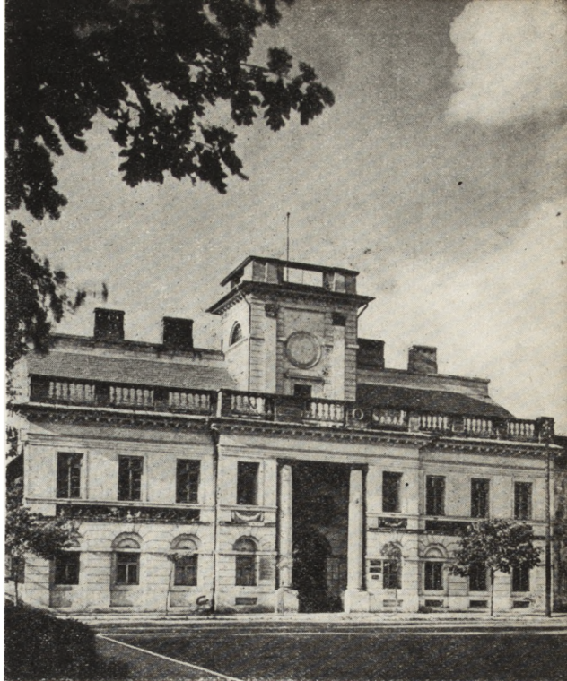
Ryc. 240. Ratusz w Łowiczu. Stan w r. 1955.

Zamki, pałace i dwory. Ukończono odbudowę i rekonstrukcję renesansowego pałacu w Poddębicach. W latach 1951—52 wykonano stropy ogniotrwałe, wzmocniono konstrukcję murów, wymieniono całkowicie wiązanie dachowe oraz zmieniono pokrycie dając w zamian blachy dachówkę ceramiczną. W roku 1953 przystąpiono do rekonstrukcji fasady po-