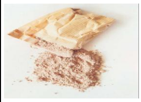
Tabela 4. Rodzaje substancji - narkotyków