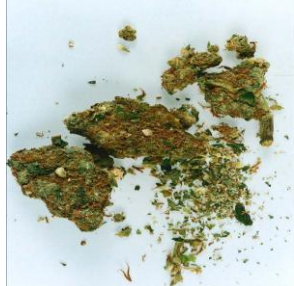
Tabela 4. Rodzaje substancji - narkotyków