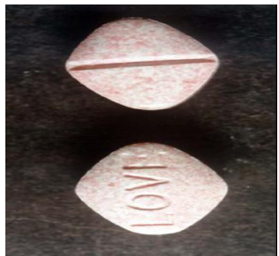
Tabela 4. Rodzaje substancji - narkotyków