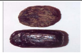
Tabela 4. Rodzaje substancji - narkotyków

Źródło: www.wojsko-polskie.pl/wortal/Skins/default/download/03%20-%20NARKOTYKI%20-%20PREZENTACJA%20(wp).pdf , dnia 12.12.2010r.