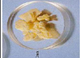
Tabela 4. Rodzaje substancji - narkotyków