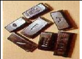
Tabela 4. Rodzaje substancji - narkotyków