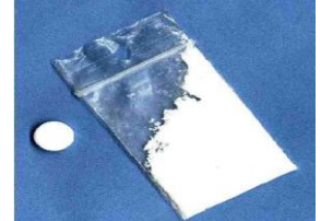
Tabela 4. Rodzaje substancji - narkotyków