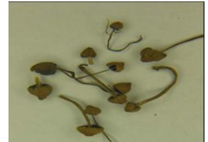
Tabela 4. Rodzaje substancji - narkotyków