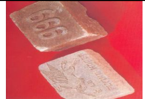
Tabela 4. Rodzaje substancji - narkotyków