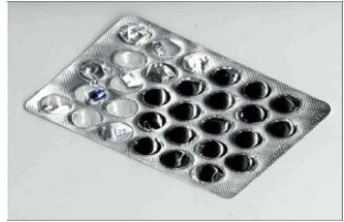
Tabela 4. Rodzaje substancji - narkotyków