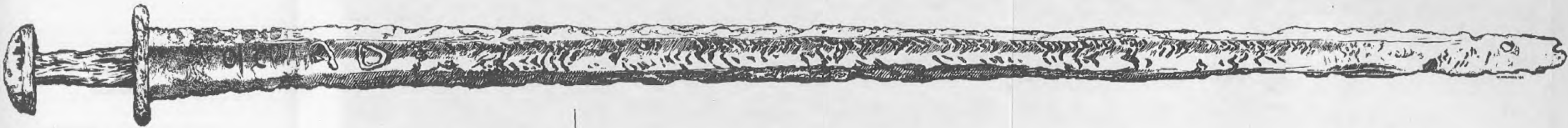
Ryc. 1. Miecz odkryty w obrębie relikwii średnio-wiecznego męstwa/grobu w Ciecza na stanowisku 2