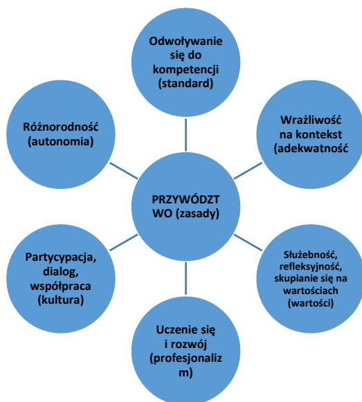
Rysunek 2. Zasady służące rozwojowi przywództwa edukacyjnego.

Podsumowaniem opisu powyższych treści jest rysunek 2, który przedstawia najważniejsze aspekty i zasady przywództwa edukacyjnego.