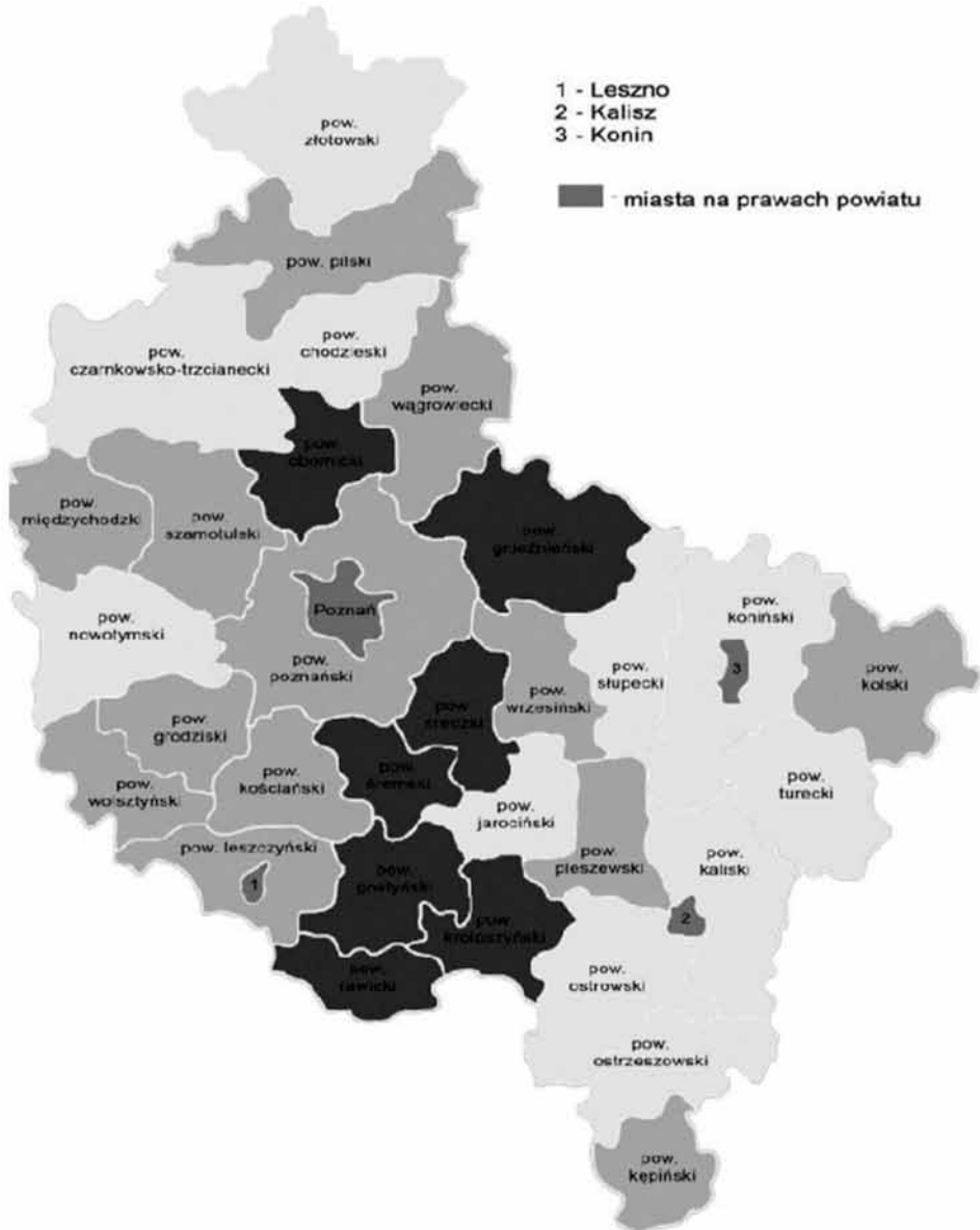
Rys. 1. Uwarunkowania zasobowe rolnictwa w Wielkopolsce względem powiatów (ujęcie lokalne)

Uwarunkowania zasobowe rolnictwa względem Wielkopolski: