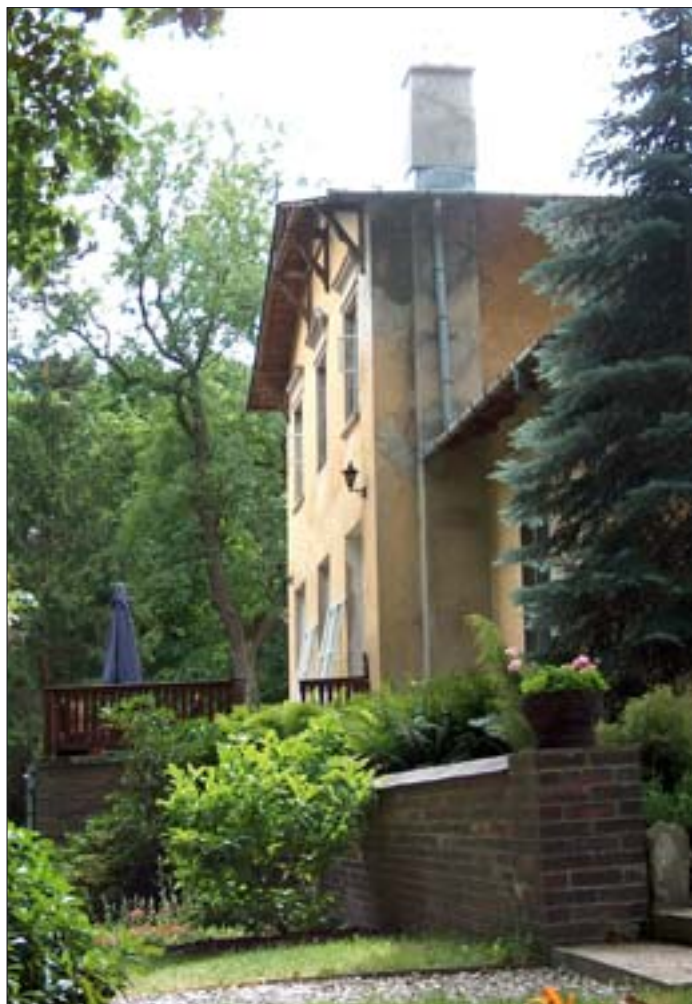
7. Willa Karolin-Marianów. Elewacja wschodnia. Fot. E. Popławska-Bukała, 2005 r.

W zachowanej części pierwotnego założenia, zaprojektowanego dla Karola Jana Szlenkiera przez Waleriana Kronenberga, ograniczonej od zachodu łąką (pierwotnie stawem), od północy rowem