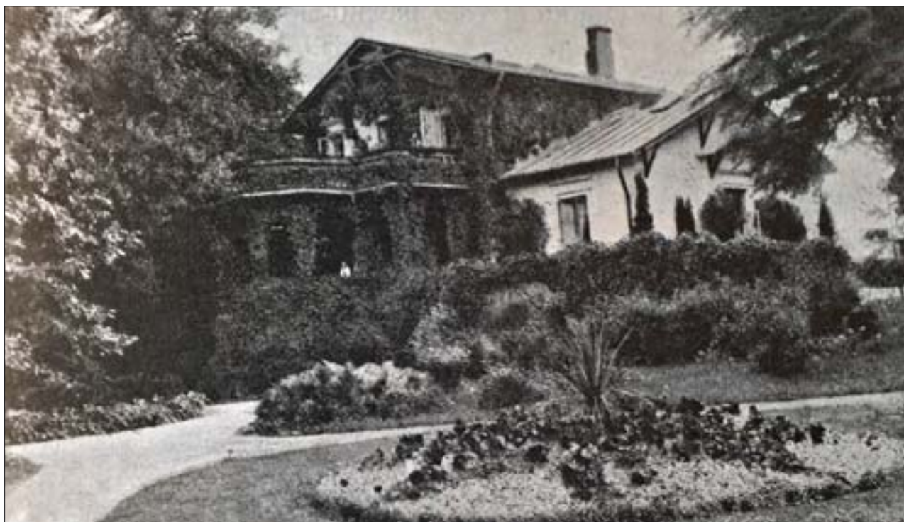
4. Pałacyk w Wiązownie, obrosnięty pnąciami. Fot. A. Maciejewski (w:) S. Skawiński, Wrażenia z wycieczki członków Komisji Połączonych TOW do Wiązowny , „Ogrodnik”, 1913, nr 34.