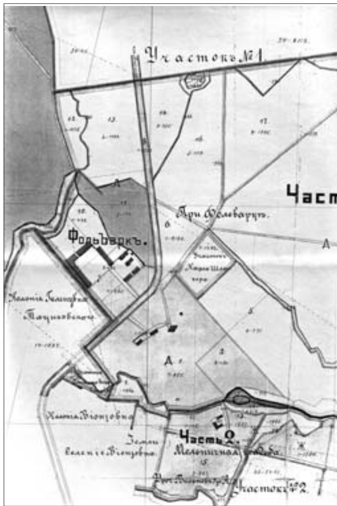
2. Plany z 1878 i 1891 r. zestawione w 1898 r. Sąd Rejonowy w Otwocku, KW Mieczysławów A nr 3052. 2. Plans from 1878 and 1891 amassed in 1898. Regional Court in Otwock, KW Mieczysławów A no. 3052.

Po II wojnie światowej rozległy niegdyś teren posiadłości systematycznie ulegał parcelacji. W ostatnich latach proceder ten nasilił się w takim stopniu, że w celu ochrony przed zabudową wydzielonych w parku działek Wojewódzki Konserwator Zabytków wszczął z urzędu procedurę wpisu do rejestru zabytków województwa mazowieckiego willi z parkiem. Zwrócił się do Krajowego Ośrodka Badań i Dokumentacji Zabytków o pomoc merytoryczną przy określeniu granic historycznego założenia oraz ocenę wartości i stopnia zachowania willi. Wykonana na potrzeby WKZ kwerenda źródeł wykazała istnienie materiałów, które rzucają nowe światło na historię obiektu, jego wartość zabytkową oraz granice, w których powinien podlegać ochronie. Niestety wykazała ona także, że księga hipoteczna zatytułowana „Willa Karolin-Marianów” 3 , która mogłaby odpowiedzieć na wiele pytań związanych z najdawniejszą historią założenia, uległa zniszczeniu podczas II wojny światowej. Nie udało się także odnaleźć żadnych planów sytuacyjnych ani projektów architektonicznych 4 ,