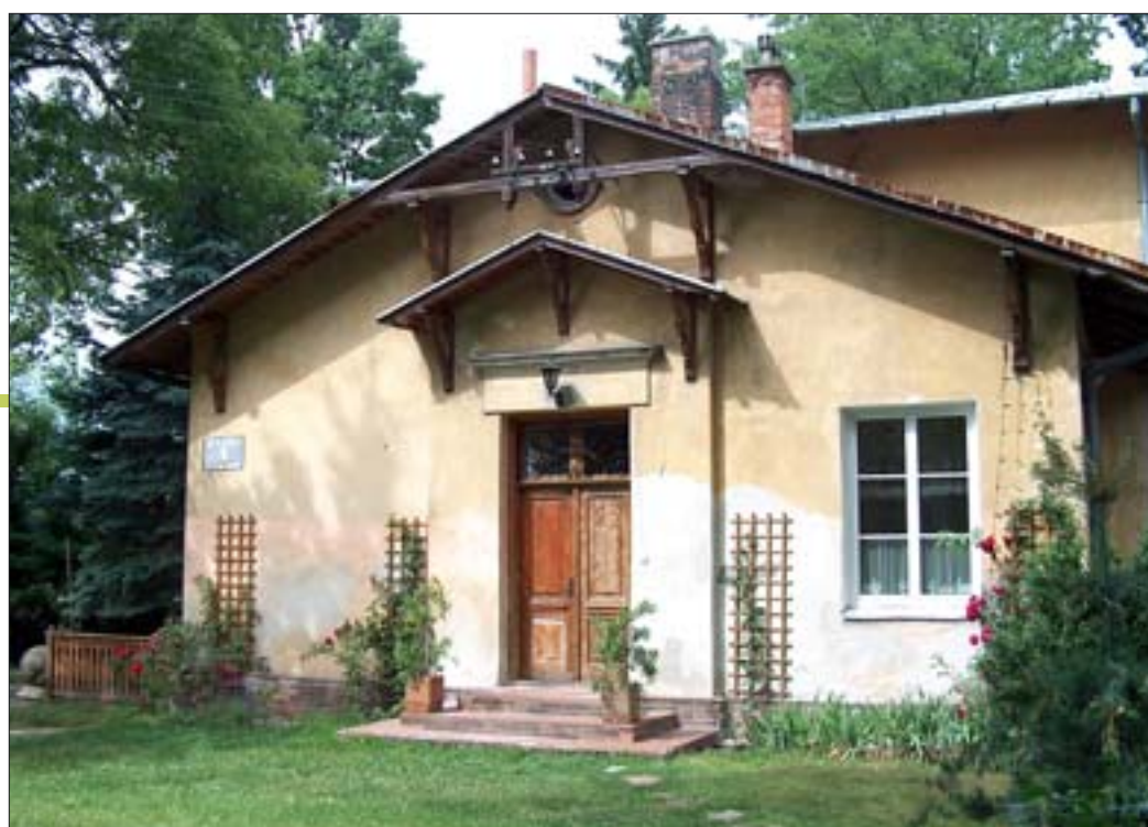
8. Willa Karolin-Marianów. Elewacja południowa. Fot. E. Popławska-Bukała, 2005 r. 8. The Karolin-Marianów villa. Southern elevation. Photo: E. Popławska-Bukała, 2005.

Układ wewnętrzny willi jest dwuipółtaktowy: przez środek biegnie korytarz zaprojektowany na osi północ-południe, mieszczący schody na piętro i strych, oraz główne wejścia do budynku. Pozostałe dwa wejścia prowadzą od strony wjazdu na teren posesji i od tyłu. W części parteru znajdowały się dawniej: salonik, jadalnia, dwie sypialnie, kuchnia ze spiżarnią, łazienka, ubikacje dla gospodarzy i służby. Piętro składało się z czterech sypialni 30 . Wnętrze było praktycznie urządzone i wygodne 31 . Po II wojnie światowej pierwotny układ zatarty nieznacznie przekształcenia budynku 32 , lecz nadal jest on czytelny w swoim głównym zarysie.