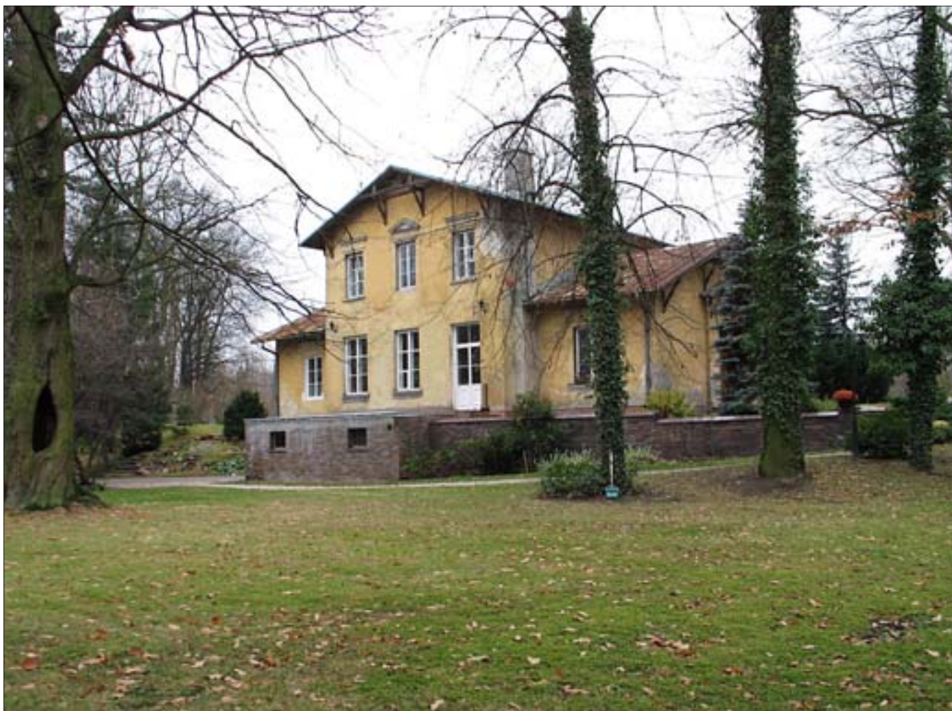
10. Willa Karolin-Marianów. Widok od pñ.-wsch. Fot. E . Popławska-Bukała, 2005 r. 10. The Karolin-Marianów villa. View from the northt-east. Photo: E . Popławska-Bukała, 2005.