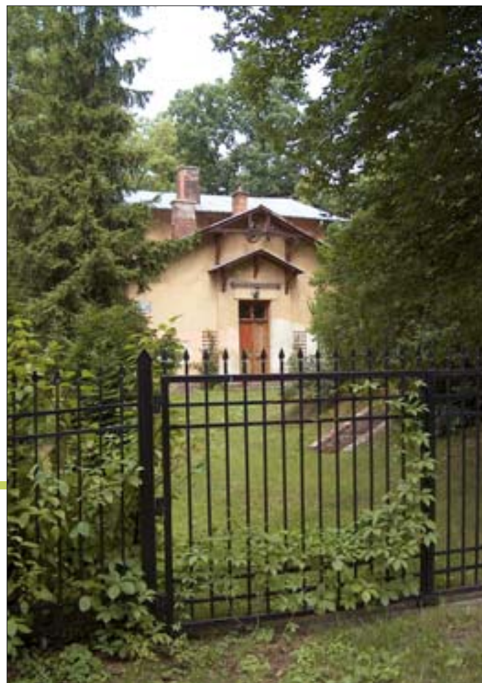
6. Widok założenia od ul. Parkowej.

Roślinność parku skomponowana była z myślą o wykorzystaniu walorów dekoracyjnych poszczególnych gatunków roślin. M. Niklewiczowa pisała: „Ogród dziadków był tak zwany ogrodem angielskim, urządzonym parkowo, tylko przy domu posiadał bardziej geometryczne rozplanowanie właściwe ogrodowi francuskim. Drzewa i krzewy rosły swobodnie, usuwano jedynie dziczki, martwe gałęzie lub