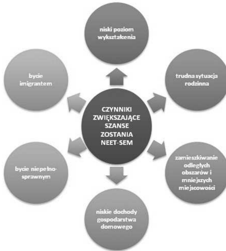
Rys. 3. Główne czynniki oddziałujące na zwiększenie szansy zostania NEET-sem