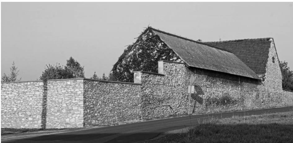
Rysunek 5. Przybyńów. Zabudowania należące do parafii.