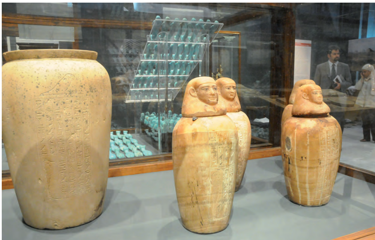
Obr. 6 lufaovy kanopy a soubor vešebtů / Fig. 6 Canopic jars and ushabtis of lufaa

Podobný soubor exponátů, obohacený o nálezy z posledního desetiletí, se nyní objevuje i v Praze, a to na výstavě „Sluneční králové“ v Národním muzeu, která by měla být otevřena na konci srpna 2020.