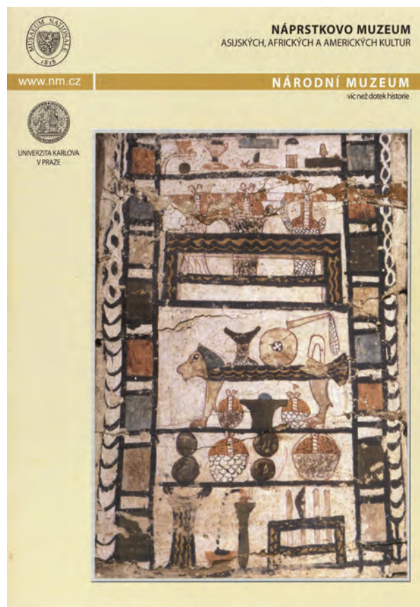
Obr. 2 Titulní strana pozvánky na výstavu „Abúsír. Tajemství pouště a pyramid“ / Fig. 2 The cover of the invitation to the opening of “Abusir. Secrets of the desert and pyramids”

Jedna z prvních větších výstav po pádu železné opony vrátila „exilovému“ egyptologovi Jaroslavu Černému jeho místo v dějinách československé egyptologie. „Tvůrci hrobů egyptských králů“ (Bareš – Strouhal 1992) byli představeni v Praze a také v regionálních muzeích, a to v historicky přelomové době rozdělení Československa.