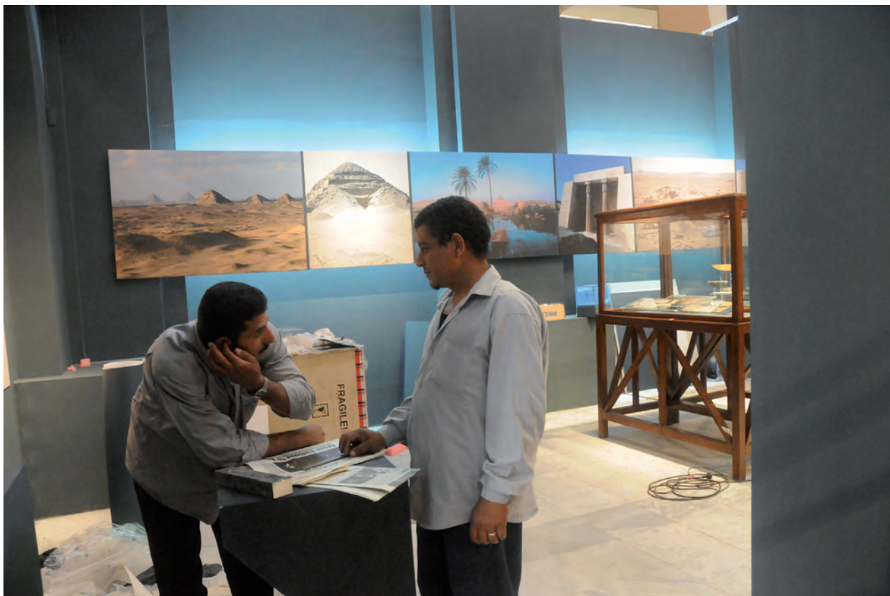
Obr. 4 Příprava výstavy v Káhiře. V pozadí s fotografiemi Abúsíru / Fig. 4 One of the Cairo exhibitions in the making, including photographs and artefacts

po roce 1989 a většímu počtu studentů oboru bylo možné k této výstavě připojit i doprovodný program v podobě komentovaných prohlídek, obsáhlého přednáškového cyklu a příslušně obsáhlé propagace v médiích.