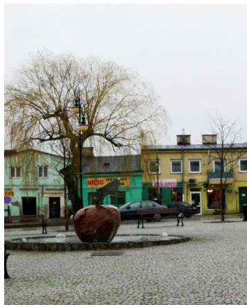
Ryc. 4. Centrum rynku z jabłkiem – symbolem współczesnego Tarczyna

Odzyskanie w 1993 r. statusu miasta zmieniło funkcję administracyjną Bieżunia. Miasto, jak i inne, które ten status odzyskały, jest siedzibą gminy miejsko-wiejskiej, głównie rolniczej (z hodowlą drobiu, szklarniami, drobnym przemysłem spożywczym). Rozwija się też funkcja kulturalna i edukacyjna. Pamięć o przeszłości utrwała – jedyne w Polsce – Muzeum Małego Miasta, Oddział Muzeum Wsi w Sierpcu, eksponującego kulturę materialną małego miasta z początku XIX w., a także odbywające się na terenie gminy uroczystości związane z upamiętnieniem Bohaterów Powstania Styczniewego na Północnym Mazowszu.