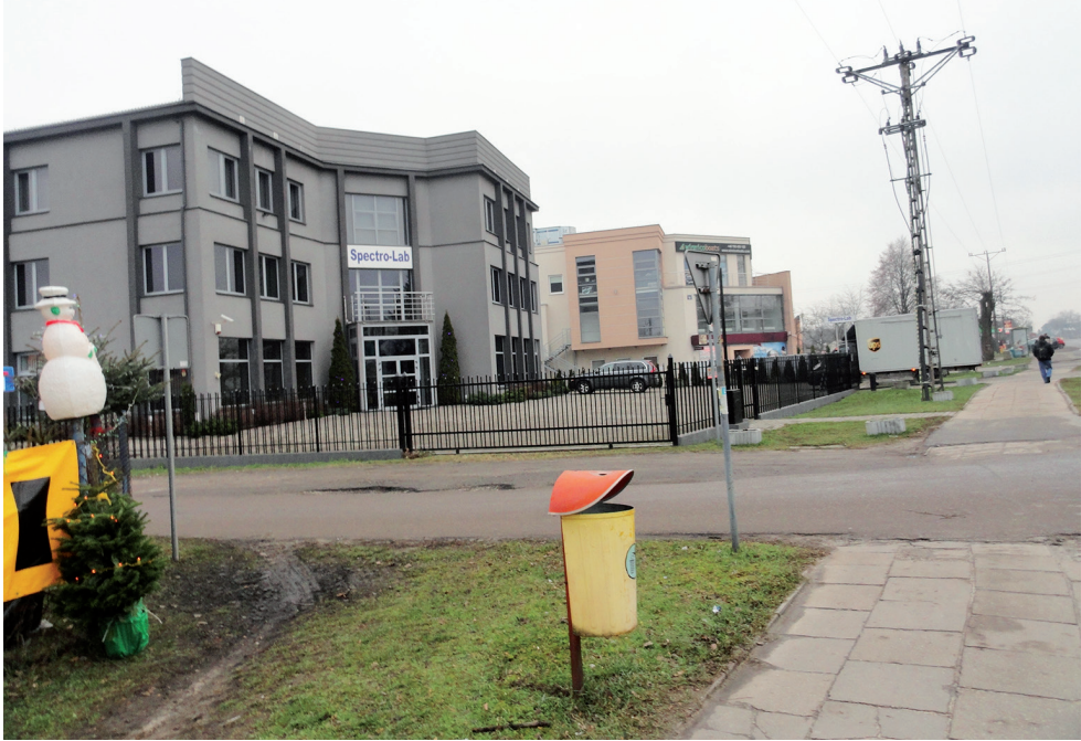
Ryc. 5. Zabudowa ul. Warszawskiej, głównej ulicy Łomianek