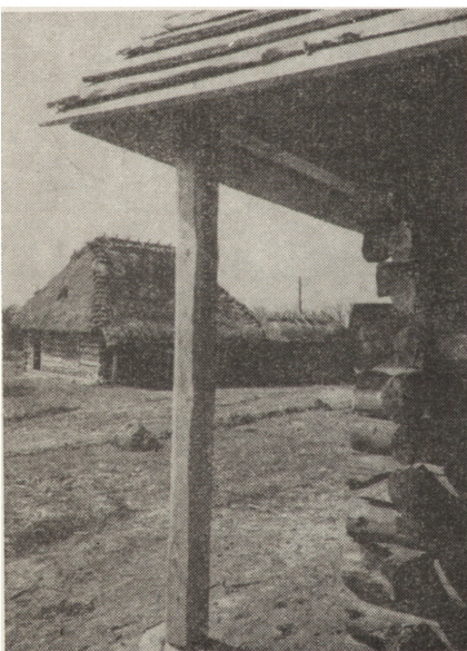
2. Park etnograficzny na Sławinku w Lublinie w trakcie budowy: A — sektor Wyżyny Lubelskiej; B — okólnik z Urzędowa

i szkołę oraz zbudowano według oryginalnych wzorów obórkę i piec garncarski. Ponadto 13 obiektów, rozebranych i przewiezionych do Lublina, oczekuje na montaż, a 17 budynków już wykupionych przez muzeum nadal pozostaje w terenie. Łącznie Muzeum Wsi Lubelskiej posiada już 54 obiekty, co stanowi około połowy wszystkich zabytków przewidzianych do ustawienia w skansenie na Sławinku. Z innych ważniejszych prac należy wymienić ogrodzenie terenu, budowę murowanego magazynu muzealiów (do czasu adaptacji dworu na Sławinie mieszczą się tu biura MWL), rozpoczęcie budowy zaplecza technicznego, przywrócenie naturalnego biegu rzeki oraz przystąpienie do kopania zbiornika wodnego z trzema spiętrzzeniami dla młynów i tartaka.